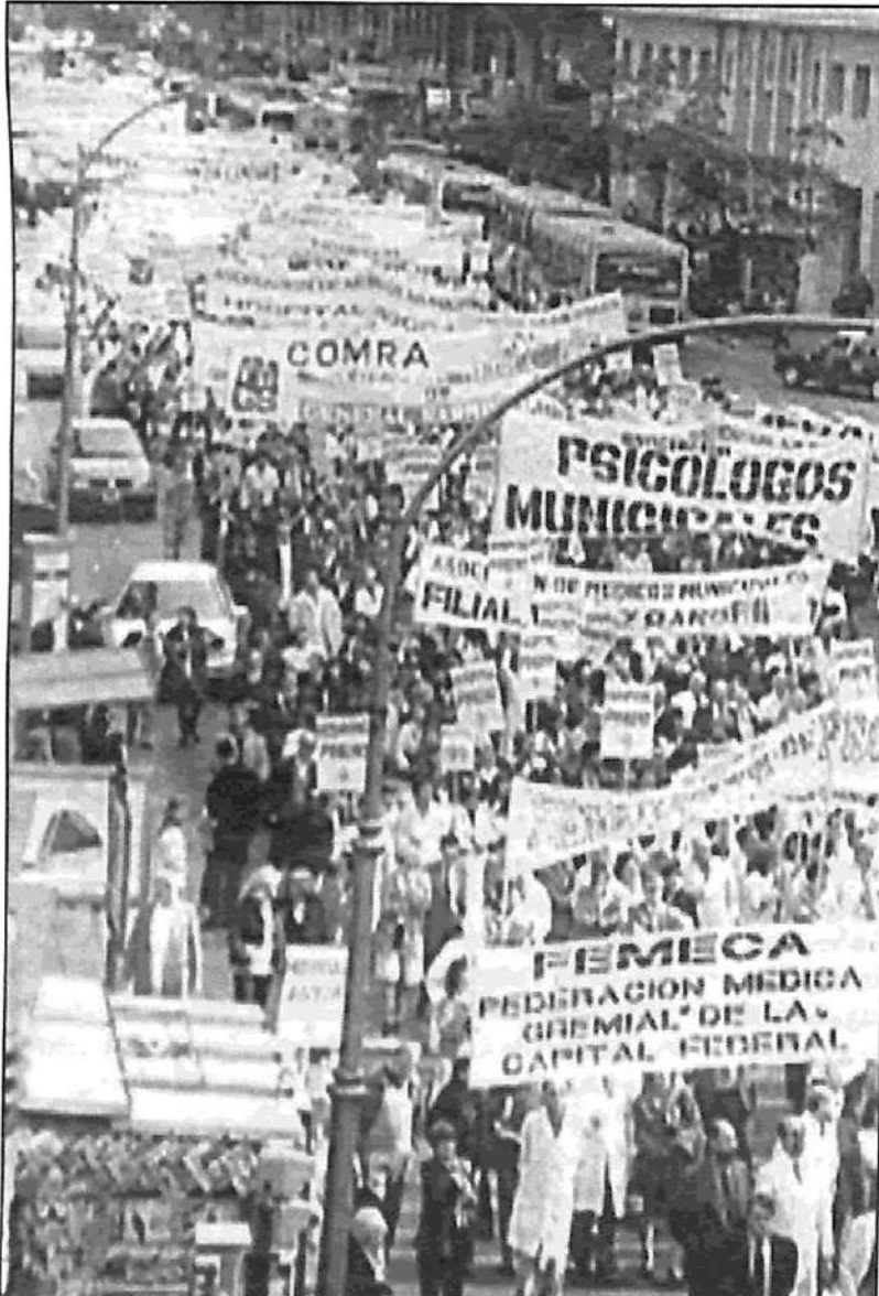
Médicos en lucha contra el gobierno aliacionista de la Capital: La experiencia principal del país se procesará, por cierto, en torno de la furiosa política fondomonetarista de De la Rúa. Ya se encuentran agendados paros docentes y de médicos, que tienen que ver con el próximo 'ajuste'.

en cuenta, como factor fundamental, a la experiencia de las masas y al desarrollo de su conciencia de clase, los desaciertos de análisis y previsión respecto de los resultados del domingo constituyen una advertencia. Hemos abordado con relativa superficialidad la cuestión del desarrollo de las masas, la cual, sin embargo, exige una atención absoluta. Lo del domingo es, incluso, un problema menor; lo que no es menor es el proceso político que enfrentamos de ahora en más, que sólo podrá ser superado asimilando la crítica a nuestras caracterizaciones. Aunque ya no es el momento de abordarlo, la insuficiencia de nuestra apreciación del desarrollo de las masas en el plano político, subjetivo, de la conciencia de clase, es seguramente el factor que ha hecho más lento y dificultoso el desarrollo del Partido Obrero en los últimos veinte años. Las elecciones del domingo han obrado