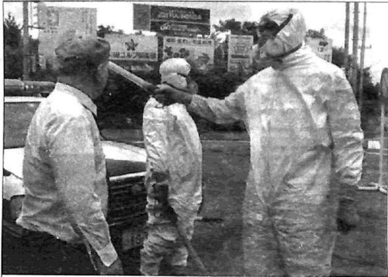
La población de Tokaimura sometida al terror nuclear: como en el ‘accidente’ de Lapa, la ‘reducción de costos’ capitalista fue el motivo de la tragedia

El accidente de Tokaimura fue el más grave de una serie de ‘accidentes’ que se vienen produciendo en Japón desde 1995: nueve en apenas cuatro años. Cinco días después, se produjo otro ‘accidente’ en la vecina Corea del Sur. Esta “cadena de accidentes” ( El País , 3/10) ha puesto en cuestión el futuro de la energía nuclear en el Japón y amenaza con “acelerar la declinación a largo plazo de la industria nuclear en todo el mundo” ( Financial Times , 2/10). Es decir, que plantea una desvalorización de capitales por varios cientos de miles de millones. Esta perspectiva explica las revisiones de urgencia que ordenaron todos los gobiernos. La salvaguarda de los sitios nucleares ha sido objeto, incluso, de un acuerdo entre los Estados Unidos y Rusia: se teme una repetición de la catástrofe de Chernobyl.