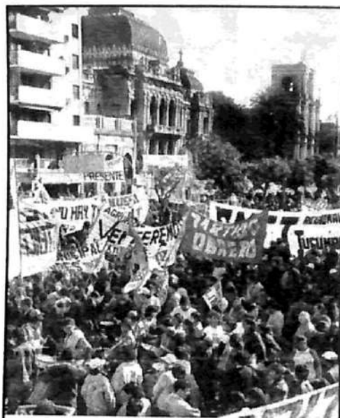
No hubo una sola mención a luchar contra la desocupación; de la flexibilización laboral y de la superexplotación y del salario 'se olvidaron'. El Congreso de 'Unidad' de espaldas a las necesidades de los trabajadores

Luego Palacios 'abrió' el diálogo hacia los representantes de organizaciones menores.