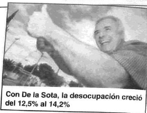
Con De la Sota, la desocupación creció del 12,5% al 14,2%

Fiat, Perkins, General Motors: las patronales están utilizando la crisis como un arma contra los trabajadores, principalmente para imponer la flexibilidad laboral y la rebaja de salarios, apelando a contratistas que, en la