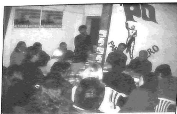
Un momento de la charla en La Paloma

El domingo 26, dos docenas de trabajadores y trabajadoras de Maqui-