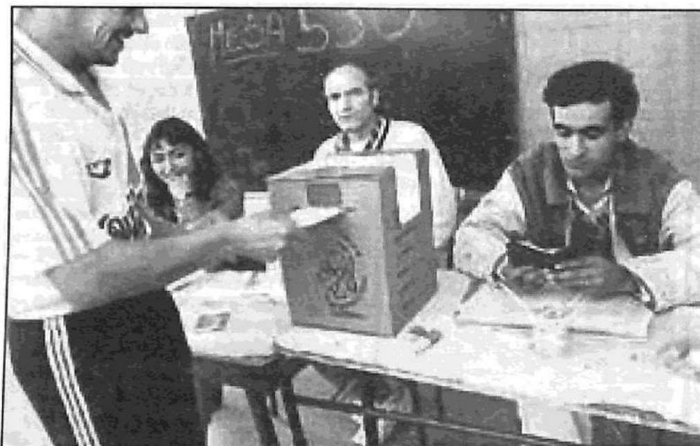
Compañero, anótese como fiscal. Para defender cada voto, por una salida obrera y socialista a la crisis

Necesitamos que, en todos los distritos, se establezcan casas electorales (ver nota sobre la Zona Sur