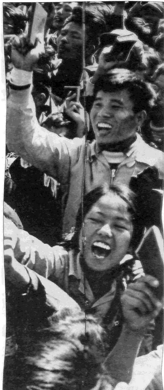
La Revolución Cultural de 1966 no fue una revolución política. Sin embargo, sirvió para dejar en claro el abismo que separaba a las masas de la burocracia, la potencialidad de la revolución política y la enorme debilidad de la burocracia frente a las masas

La burocracia china actúa a tientas. Se efectúa una