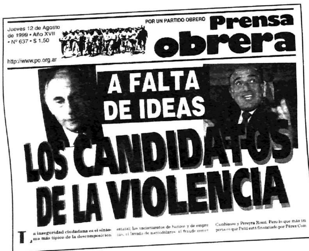
Tapas de Prensa Obrera n° 637, del 12 de agosto de 1999

Las fuerzas represivas, sin embargo, no son más que una expresión del régimen político y social al que sirven y que las sostiene. En un régimen social en bancarota, las fuerzas represivas están condenadas a repetir, una a una, todas las lacras del régimen al que responden. Para darle seguridad al pueblo trabajador, hay que disolver todos los cuerpos represivos y desmantelar el Estado capitalista.