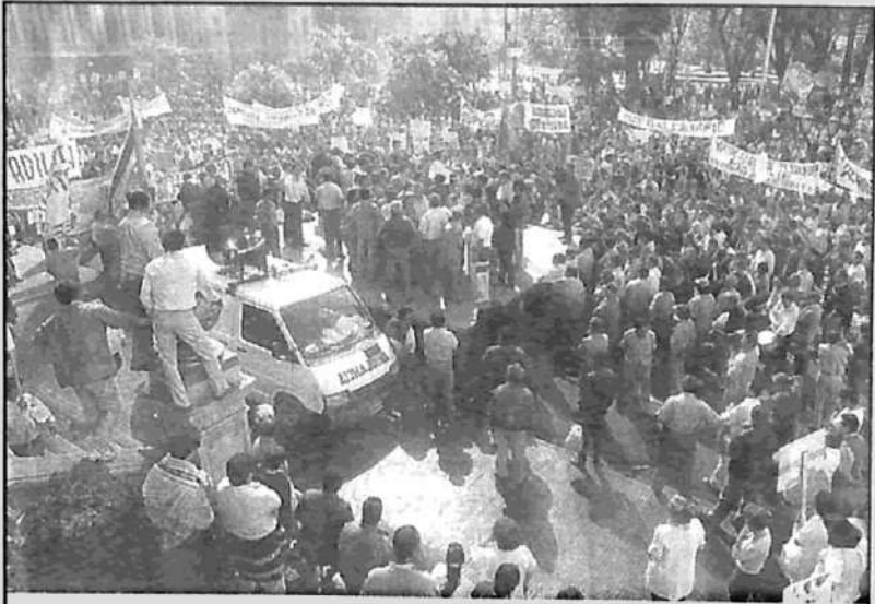
Crece como bola de nieve las luchas de los trabajadores: varios gremios están en paro general, los cortes de ruta se están generalizando, las movilizaciones son masivas.

Bussi ya fue. Su última medida fue vetar la Superley. Con ello recogió el reclamo de todo un arco de intereses (proveedores) que temen que se desconozcan las deudas contraídas por el Estado. Al mismo tiempo, es inminente un pedido de licencia de Bussi y han renunciado la Fiscal del Estado y el Ministro de Hacienda. En el municipio de la Capital, el gobierno interino de Uasuf también se está desmoronando con la renuncia masiva de funcionarios. El vicegobernador Topa acaba de romper con Fuerza Republicana, arrastrando a todo el sector agrupado en el NOS (Nuevo Orden Solidario), que reúne a la mitad del aparato partidario y legislativo del bussismo. Este sector está negociando con el PJ y el cavallismo.