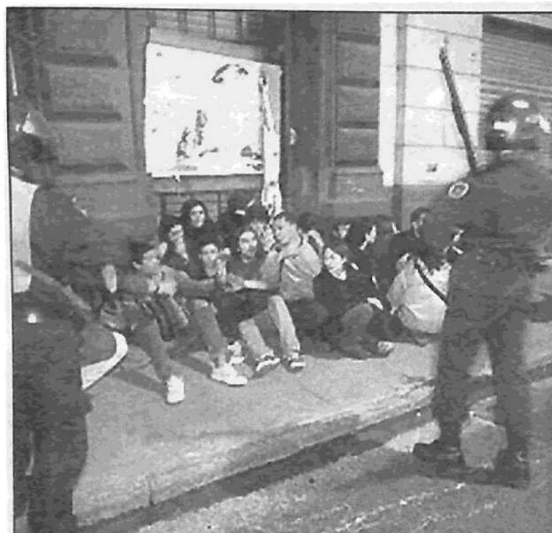
Emboscada policial contra los manifestantes de La Noche de los Lápices: no podrán parar la rebelión juvenil

La Coordinadora de Estudiantes Secundarios ha convocado una reunión de todos los estudiantes para repudiar la represión policial contra el movimiento estudiantil, exigir el cese de todas las causas penales contra