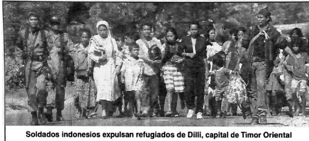
Soldados indonesios expulsan refugiados de Dilli, capital de Timor Oriental

La masacre contra el pueblo timorense apunta a condicionar el proceso de la independencia, es decir, a conservar el tutelaje del régimen militar de Indonesia. En los últimos días, se habló insistentemente de un golpe de Estado en Indonesia, lo que pondría fin a la transición organizada para suceder al depuesto régimen de Suharto. El gobierno fue salvado gracias a una intervención internacional, que ha ofrecido al alto mando militar garantías de tutelaje sobre Timor