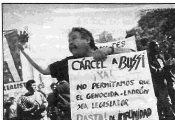
La 'super-ley' cuestiona la misma sobrevivencia de miles de trabajadores. Para derrotarla, impulsemos la huelga indefinida