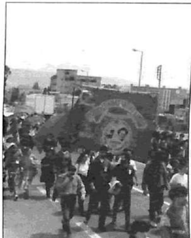
1º de Mayo de 1998: el Partido Revolucionario de los Trabajadores (EEK) manifiesta por las calles de Atenas

Para explorar y promover esta perspectiva de emancipación, el Partido Revolucionario de los Trabajadores (EEK de Grecia), junto con la Liga Marxista de los Trabajadores de Turquía, llama a una conferencia de los trabajadores y las organizaciones populares de los Balcanes, incluyendo grupos juveniles y culturales, asociaciones científicas y artísticas; llama a cada luchador, activista y ser pensante que resiste los planes imperialistas de un tiránico ' Nuevo Orden Mundial ' y rechaza los odios nacionales y las divisiones promovidos por los gobernantes locales y extranjeros; llama a todos aquellos que se oponen al ' camino del mercado ' para la colonización de los Balcanes y que todavía están inspirados por la perspectiva de una sociedad socialista libre e igualitaria; llama a participar de la Conferencia Anti-Otan de todos los Balcanes, en Atenas, el 27 y 28 de noviembre del corriente año.