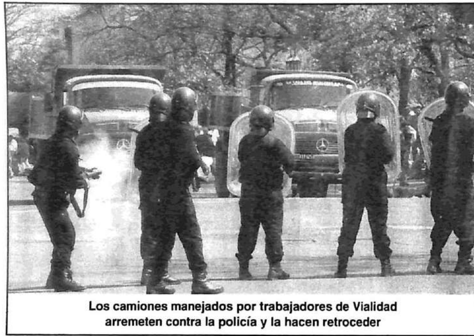
Los camiones manejados por trabajadores de Vialidad arremeten contra la policía y la hacen retroceder

La existencia de un profundo movimiento de