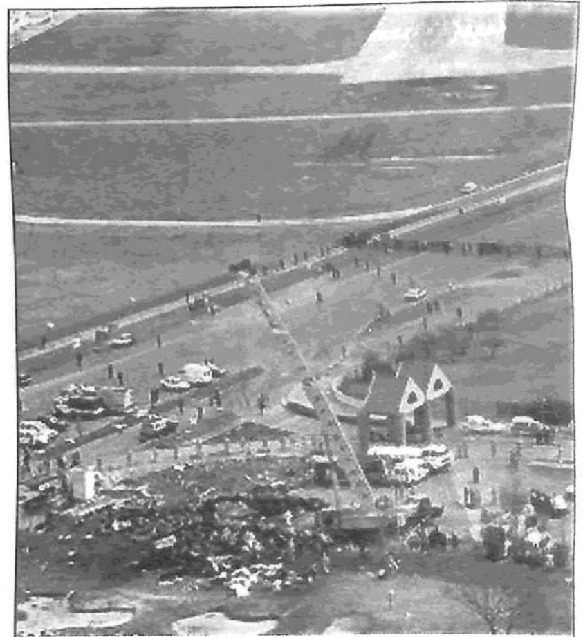
Fray Bentos (1997), Aeroparque (1999): las consecuencias criminales de las privatizaciones y la 'desregulación' capitalistas

¿Pero acaso el impuesto docente es la causa de que Lapa redujera los estándares de mantenimiento hasta volar aviones en condiciones de riesgo? Lo