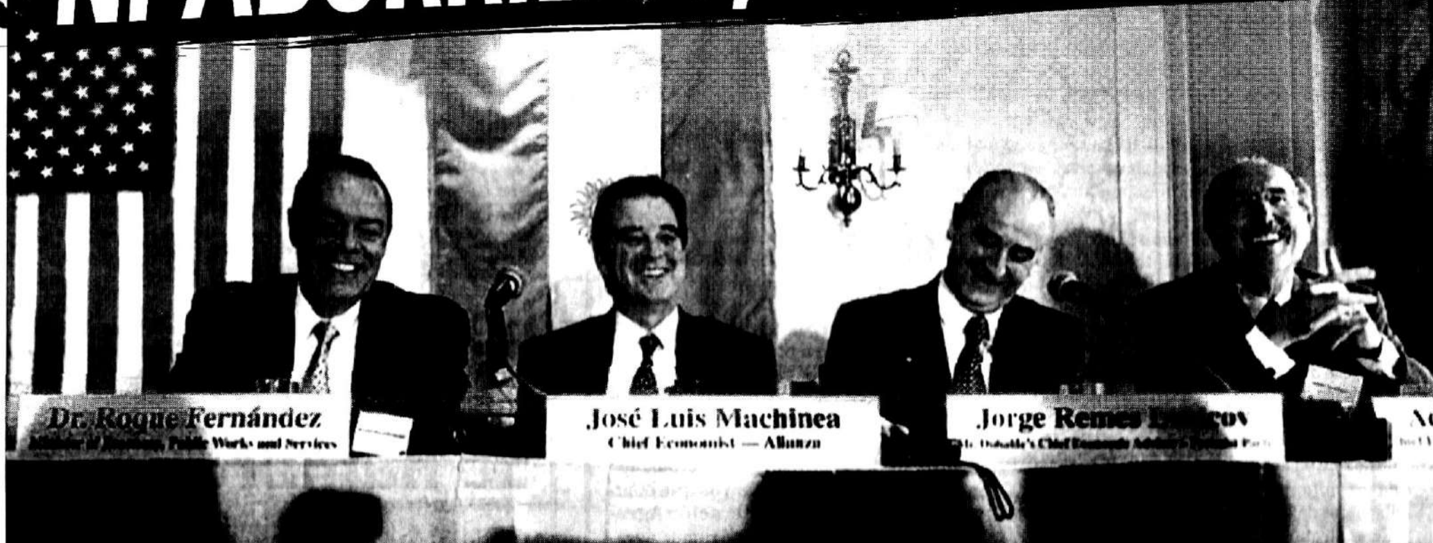
Dr. Roque Fernández Minister of Economy, Public Works and Services