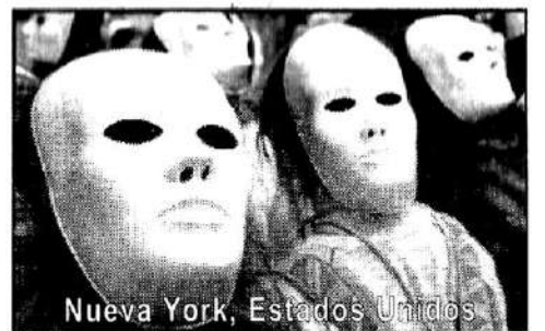
Nueva York, Estados Unidos

E l 1º de Mayo, en Grecia, Turquía, Italia, España, Brasil, Uruguay, Chile y en muchos más países, la clase obrera será llamada a movilizarse tras una proclama común. Es la declaración que se puede leer a continuación. En la Argentina, el PARTIDO OBRERO convoca con esta misma declaración a movilizarse este 1º de Mayo al Parque Centenario en la Capital y a las decenas de actos que se desarrollarán en todo el país. "Trabajadores del mundo, uníos" comienza a hacerse nuevamente realidad ante la crisis y la guerra imperialistas.