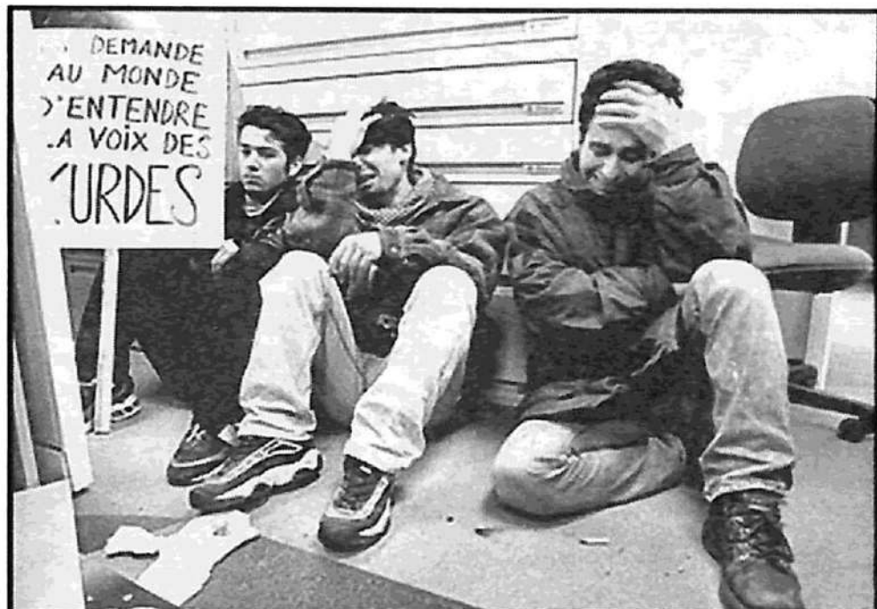
"Reclamamos al mundo que se escuche la voz de los kurdos"

Es la situación de auge de la lucha por la emancipación del pueblo kurdo, especialmente en la región del Kurdistán colonizada por los turcos, lo que explica que incluso los políticos pro-Otan de este país "se muestren nerviosos ante la iniciativa norteamericana de patrocinar una zona de auto-