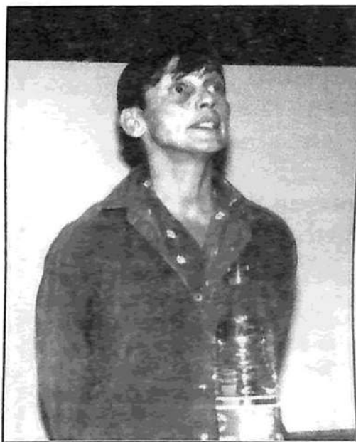
La delegada de Voix des Travailleurs (Francia) habla en el acto de Atenas

Esta conclusión acerca de la crisis mundial capitalista es muy importante, porque hasta hace muy poco se decía que lo que estaba en completa crisis era el socialismo. Se confundía la bancarrota de la burocracia, que es la negación del socialismo, con una derrota de éste. La burocracia, en