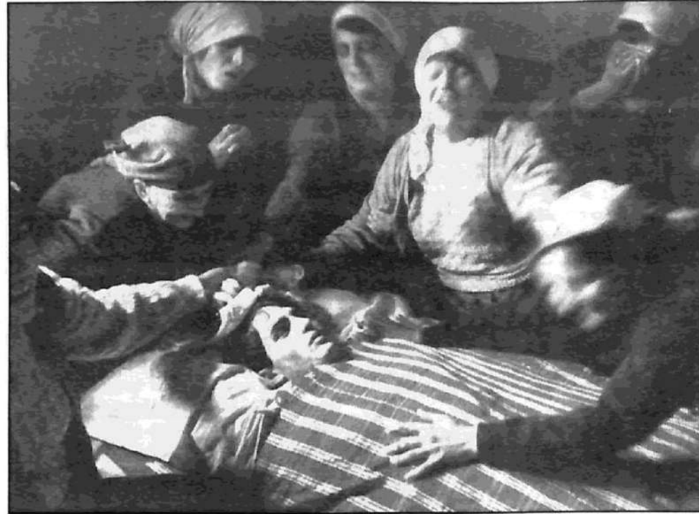
La masacre del pueblo kosovar

Con todo, las principales limitaciones de la ofensiva de la Otan son políticas. La primera es que tanto Clinton, como Blair y Jospin coinciden con Milosevic en su oposición a la independencia de Kosovo y en la defensa de la integridad territorial de la actual Yugoslavia. La segunda, peor aún, es que la Otan pretende imponerle a Milosevic la firma del acuerdo de paz que establece la presencia de tropas imperialistas en una Kosovo 'autónoma' . Pero si Milosevic acepta estas condiciones, sería derrocado por la ultraderecha nacionalista. Se trata de una contradicción flagrante