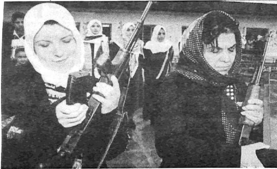
Mujeres iraquíes entrenándose ante el temor de un ataque de los Estados Unidos

Este es el régimen humanitario que las Naciones Unidas han establecido desde 1991 y que no pretende ser levantado en ningún momento próximo. (La información es de Financial Times , 3/2).