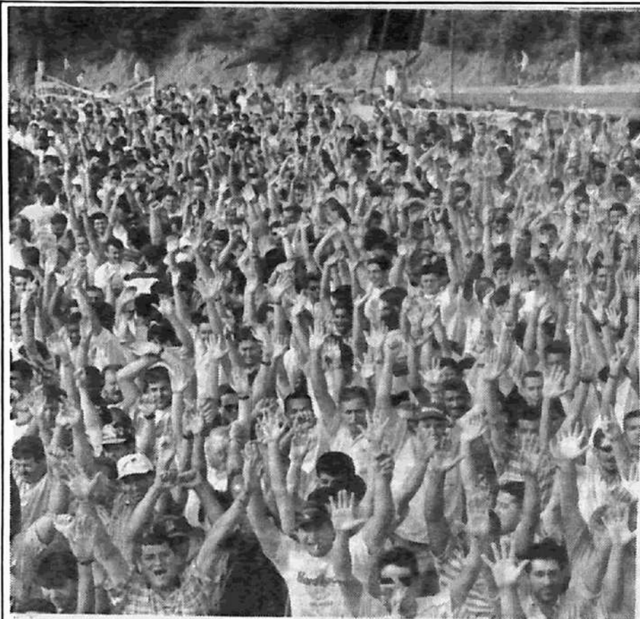
Por una campaña inmediata por el reparto de las horas de trabajo, la ocupación de toda fábrica que suspenda o cierre, un plan económico bajo dirección de la clase obrera (...) cuya estrategia es unir a América Latina en una Federación de Estados Obreros.

Arruda Sampaio denunció el desastre social que