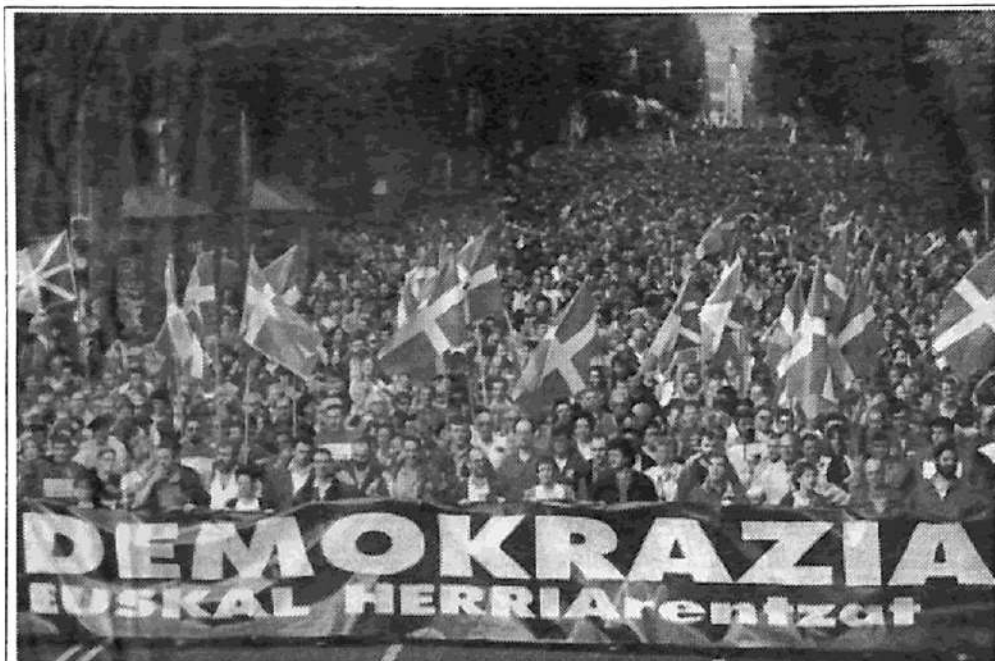
Manifestación de Herri Batasuna: "Por la democracia en la tierra vasca"

Veintitrés miembros de la dirección de Herri Batasuna acaban de ser condenados por la justicia española por difundir un video de ETA que plantea una salida negociada en la cuestión nacional vasca.