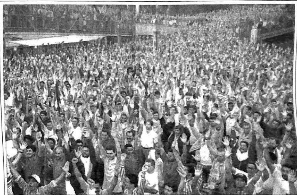
Asamblea de 15.000 obreros de Volkswagen-Brasil rechaza la reducción salarial y los despidos

"Todas las empresas del sector bajaron sus estimaciones para el año que se viene. Otras no sólo redujeron sus pronósticos, sino que concretamente producirán