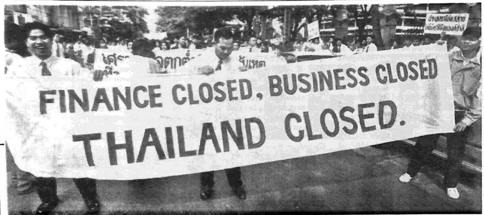
Tailandia: manifestación de trabajadores bancarios despedidos

La ola de devaluaciones y las recesiones asiáticas han golpeado claramente a China, "donde los signos de retracción económica ya eran evidentes antes del derrumbe de