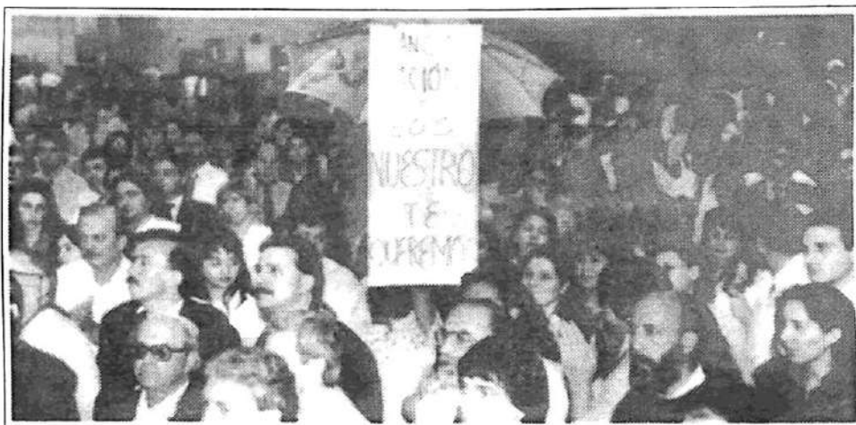
Asamblea de trabajadores del Nación: ¡No a la privatización!

* En nombre de la 'competencia', el gobierno se apresta a crear un banco privado —y extranjero— de dimensiones tan colosales que será el amo indiscutido de todo el negocio bancario y de las jubilaciones privadas.