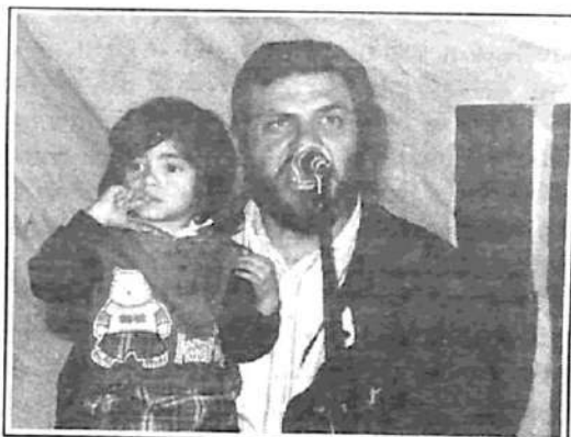
Dirigente de la Corriente Patria Libre, en la Asamblea de Pueblo Unido

Llamamos a fortalecer el sindicato municipal, para impulsar un