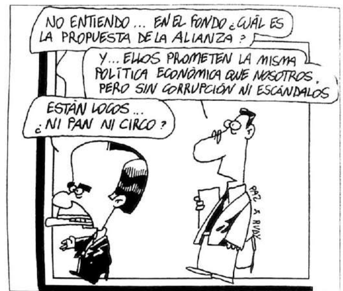
Extraído de Página/12 (19/8)