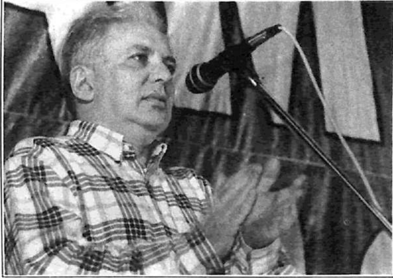
Grupo Fotográfico de la Base

Al mismo tiempo, ridiculizó el infantilismo izquierdista que se opone al subsidio porque dice que su objetivo es ‘tirar abajo al capitalismo’. Dejó en claro que para tirar abajo al capitalismo, “tenemos que evitar la degradación del obrero, porque un obrero degradado no tira abajo al capitalismo”. “Imponer-