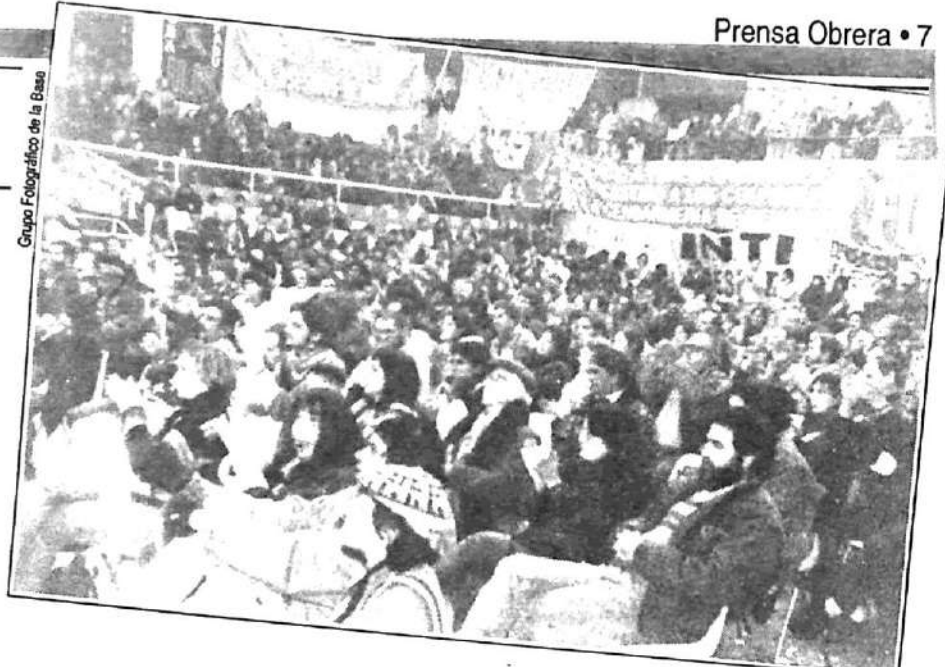
Grupo Fotográfico de la Base

Usted compañero, es el protagonista. Pronúnciese con su presencia en la organización de las Asambleas por distrito y en los Plenarios provinciales. Aquí se está forjando una real perspectiva de reagrupamiento revolucionario.