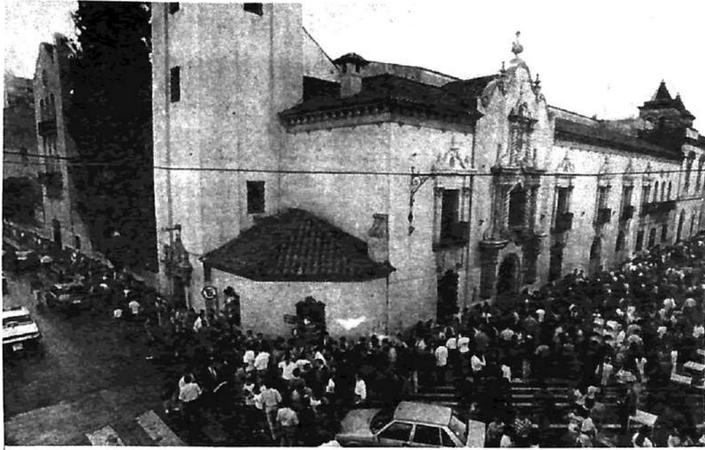
Colegio Montserrat: aquí también, ¡Abajo la Ley Federal de Educación!

El 'claustró' profesoral, uno de los protagonistas de la rebelión del Montse-