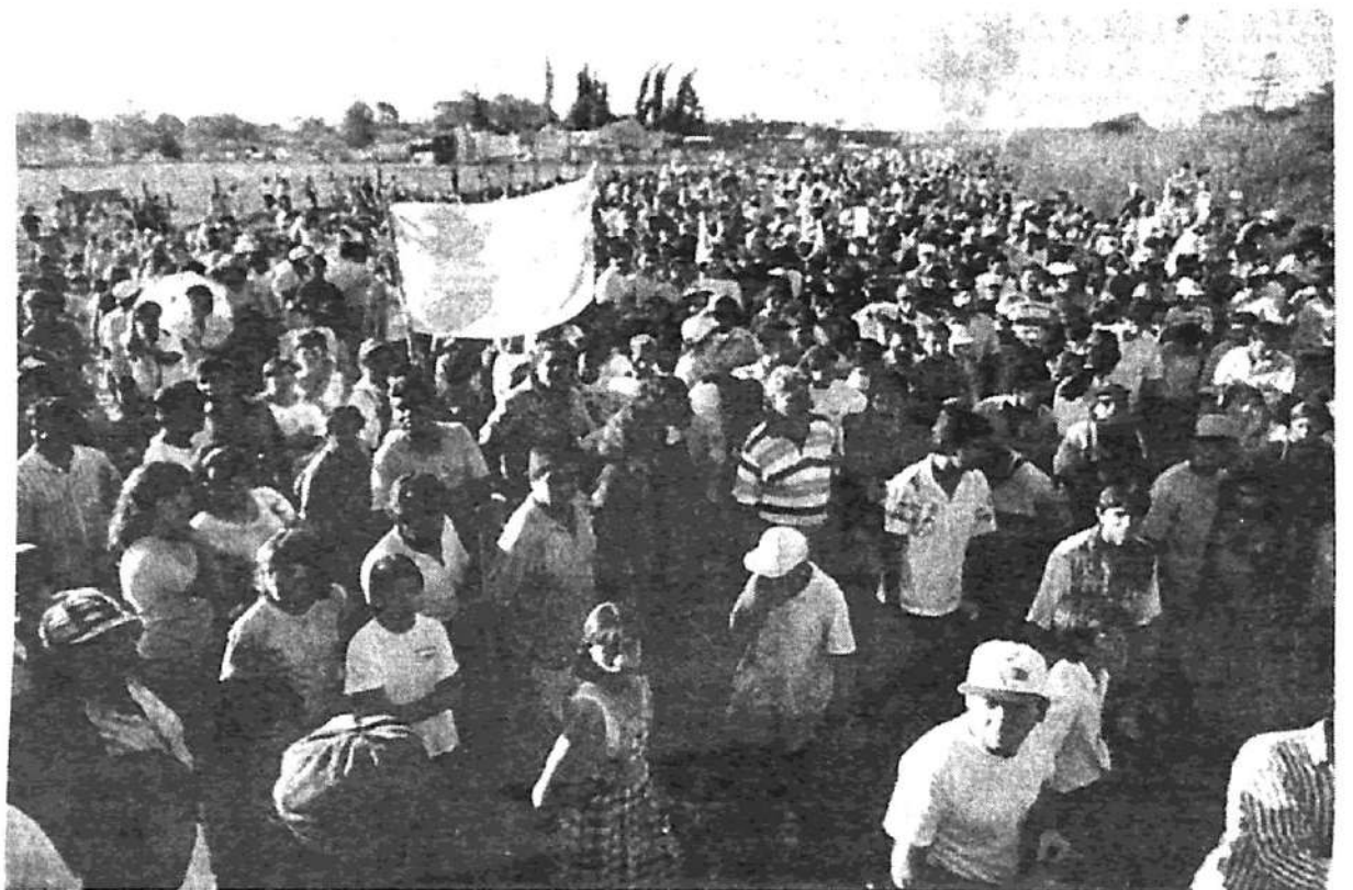
Tartagal: un piquete multitudinario en la ruta 34

Aunque los capitalistas aseguren que rebozan de optimismo, un incidente reciente demuestra lo injustificado de tanta alegría. Y no hay que olvidar que con la economía se come, se cura, se educa... y se gobierna. Es el componente