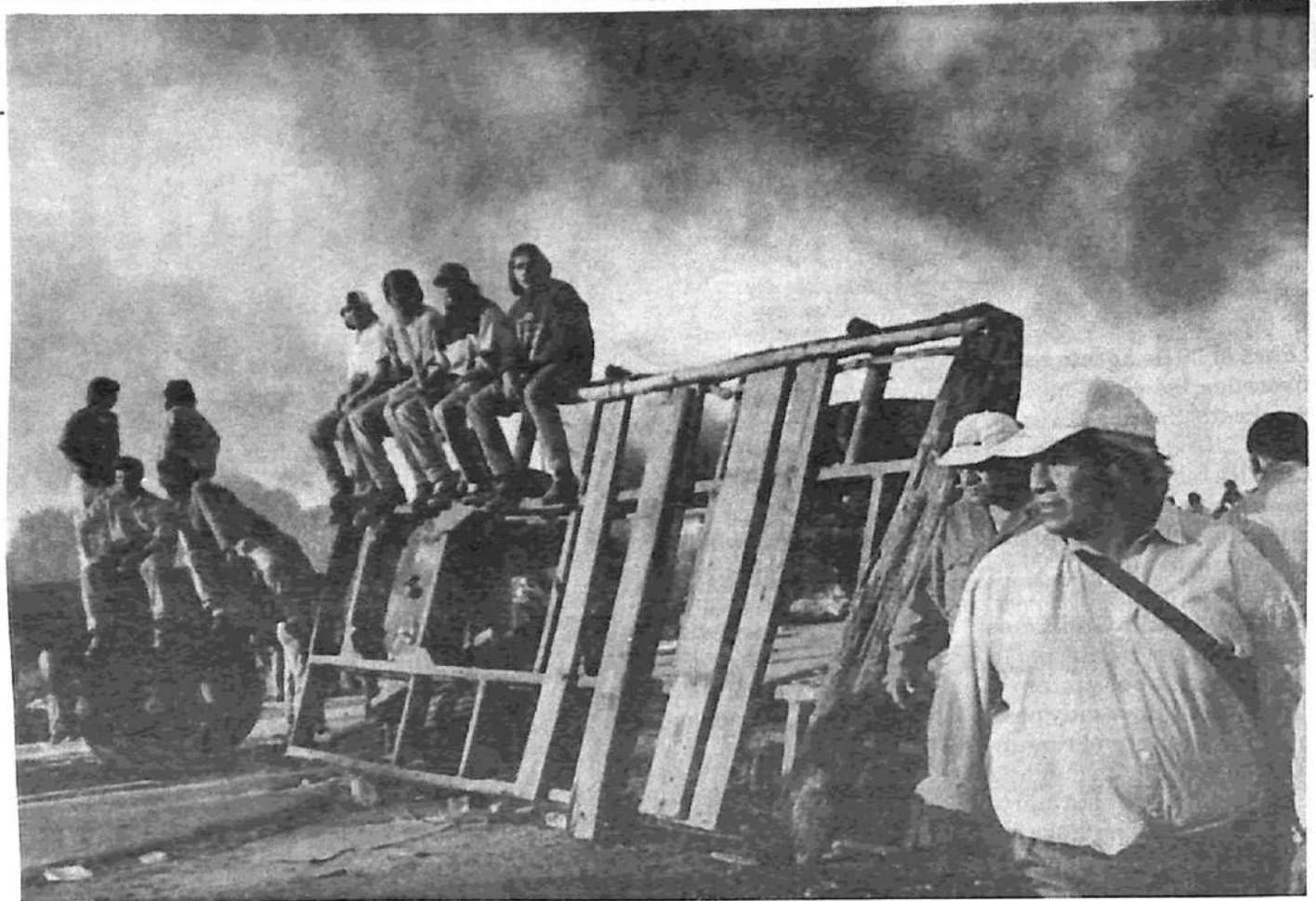
Los fogoneros en Tartagal, Mosconi, Aguaray y Comejo: el pueblo del departamento de San Martín se puso de pie

el Frepaso y un periodista, que antes del levantamiento había iniciado una huelga de hambre), o la retención de reemplazar el reclamo del subsidio por los puestos del Plan 'Trabajar'. Esta lucha ha puesto al desnudo el abismo completo entre los reclamos elementales de la mayoría de la población, en medio de las fabulosas ganancias de las petroleras, y las miserables propuestas del gobierno provincial o del gobierno nacional. Con este cuadro, ¿cómo avanzar para lograr la victoria de los reclamos? Es necesario extender la lucha y el corte a todos los pueblos y la elección de comisiones de vecinos responsables y revocables por las asambleas. Esta misma noche del martes 13, se procedería a cortar la ruta que pasa por Embarcación; para el