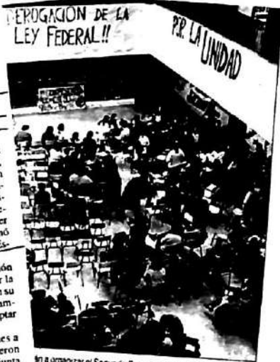
En a organizar el Segundo Congreso, que se hará en Cipolletti.

Al tiempo que repudiaron las persecuciones a desocupados y piqueteros, los jóvenes decidieron convocar a ATEN para participar en forma conjunta del paro y movilización del 26 y 27 de este mes.