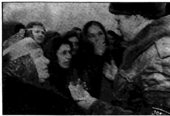
Mujeres chechenas tratan de detener el avance de los tanquistas rusos

Chechenia no conquistó su independencia, hace tres años, por medio de procedimientos democráticos, sino por decisión de una dictadura dirigida por un ex general del ejército soviético. La decisión de desconocer esta independencia luego de tanto tiempo no está relacionada, entonces, con la cuestión de los procedimientos. Tiene que ver con un problema que amenaza con provocar una guerra en todo el Cáucaso (Azerbaiján, Georgia, Armenia) — es decir, con el petróleo. El gobierno ruso firmó un acuerdo con los principales pulpos capitalistas, principalmente British Petroleum y Esso, para explotar el oro negro de Azerbaiján, el cual ha abierto un conflicto internacional con relación al trazado del oleoducto que debe transportarlo. En tanto que Yeltsin pretende que pase por territorio ruso, las compañías petroleras y sus gobiernos quieren construirlo a través de territorio turco. El conflicto ya ha llevado al gobierno de Yeltsin a intentar el derrocamiento del gobierno de Azerbaiján, el cual apoya el trazado por Turquía. Según los mejores analistas internacionales, esta divergencia explica los enfrentamientos recientes entre Estados Unidos y Rusia en diversos foros diplomáticos. La impasse petrolera amenaza ciertamente con crear una crisis internacio-