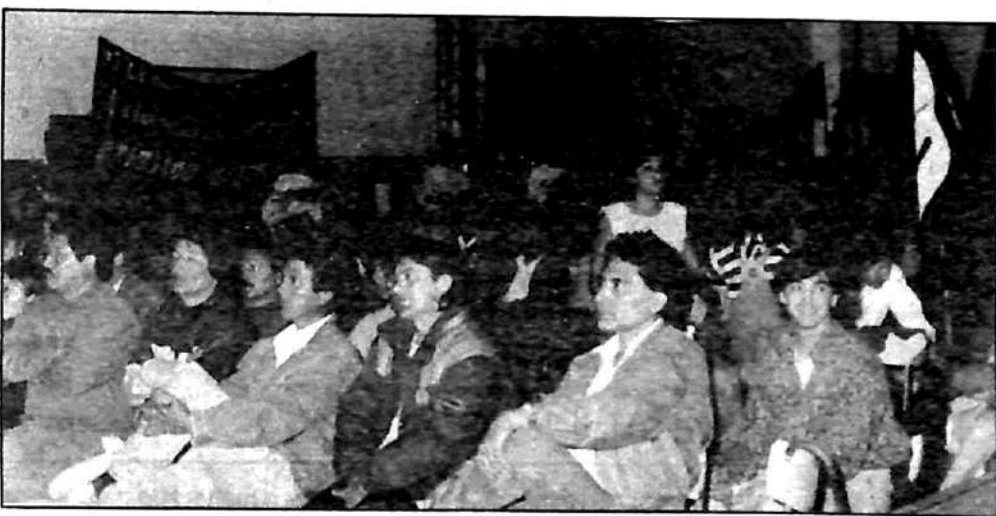
Acto del FIT en Neuquén

Después del "actazo" del 17, como siguen las luchas de los trabajadores, sigue también la campaña del FIT, con nuevas jornadas callejeras, pintadas y la lucha por los fiscales y el voto.