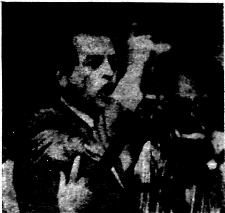
"... Zamora es el hombre que gritó 'Fuera Bush' en las propias barbas del gringo ..."