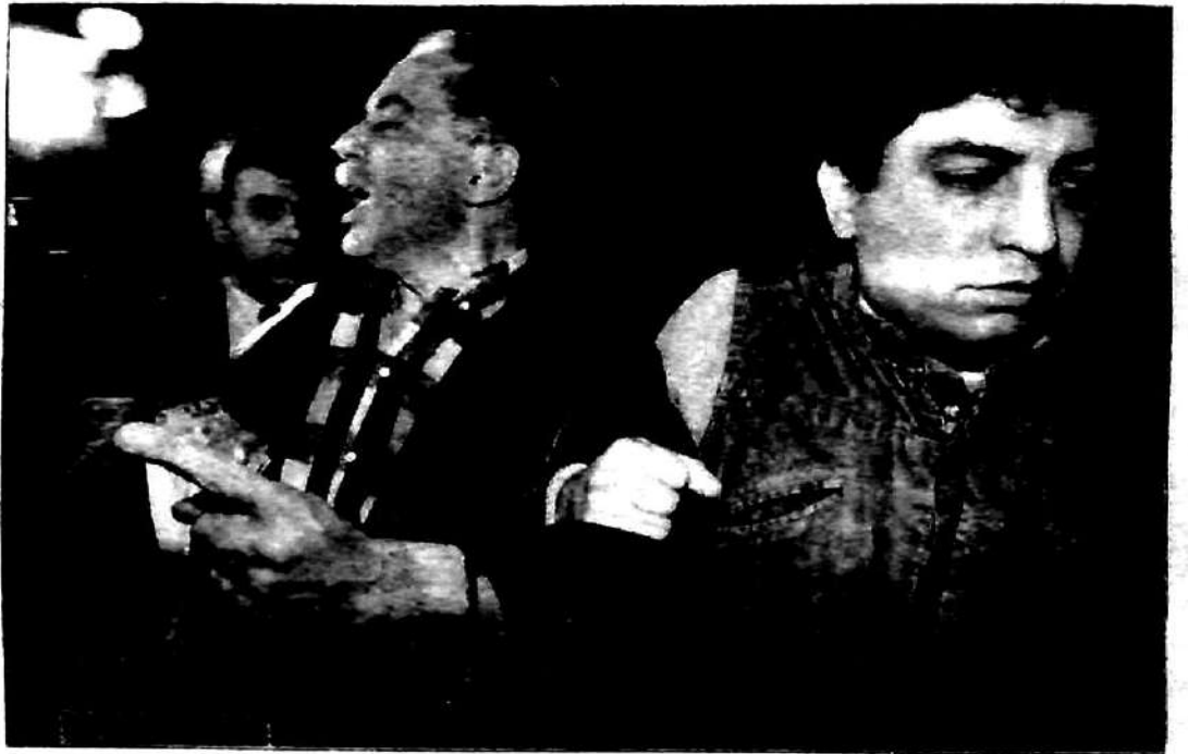
"... A Altamira lo vemos con su dedo acusador mientras es bajado por la fuerza bruta por las escaleras de la Casa Rosada después de haber denunciado a los saqueadores del país durante la hiperinflación alfonsiniana del '89..."

Cuarta razón: el FIT es la única expresión internacionalista, que lucha