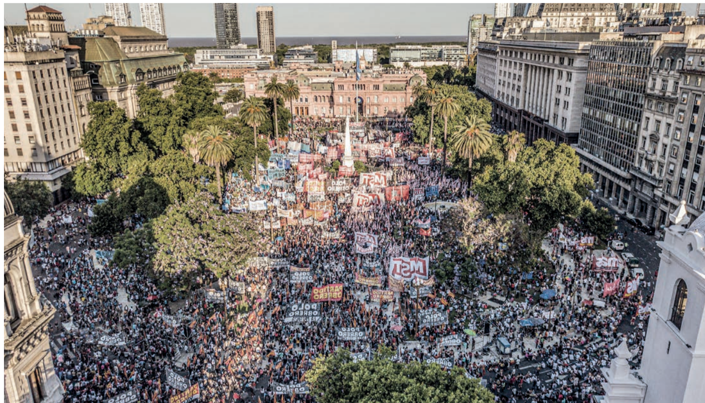
Drone Prensa Obrera

La Plaza planteó una perspectiva clara frente a un gobierno que no tiene plan B frente al FMI, pero que afronta una crisis por las consecuencias del acuerdo. Es que el fondo reclama tasas de interés positivas, tarifazos y un nuevo ajuste fiscal. Además, reclama una devaluación que ya admitió Guzmán en el Congreso al decir que la eliminación de la brecha cambiaría “no será brusca”, cosa que veremos, pero que ocurrirá, ocurrirá. Todas estas medidas golpearán fuertemente cualquier perspectiva de recuperación económica y serán un nuevo mazazo a los salarios y las jubilaciones. Impactarán en una situación social que nunca dejó de ser crítica, con el 60% de los niños por debajo de la línea de pobreza. Agudizarán la inflación, que no baja del 50% anual, que tiene su centro en el aumento de los precios de los alimentos.