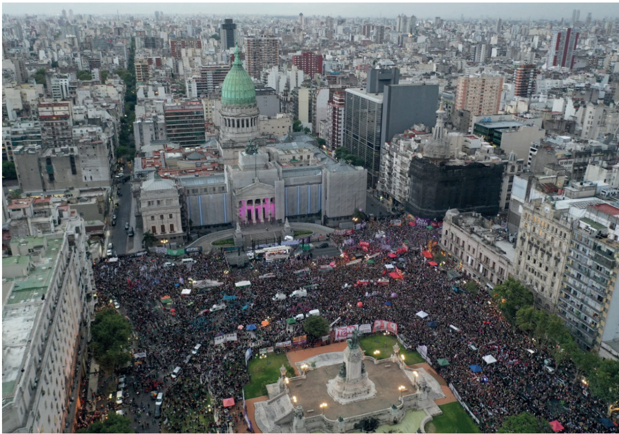
La movilización del 9M en Buenos Aires fue de Plaza de Mayo a Congreso

La reivindicación de un régimen feminista para alternativizar a un “capitalismo neoliberal”, planteo que defendieron los sectores progubernamentales con los que se discutió el documento, expresa sus propias expectativas y frustraciones, y también es una