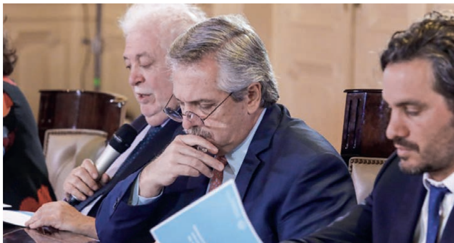
La crisis mundial, que el coronavirus puso de manifiesto y a la vez aceleró, se entrelaza con la bancarrota de la economía nacional

La quiebra fiscal convive con la parálisis de la obra pública -la inversión en este rubro retrocedió un 65% en enero- agravando la recesión. El retroceso del PBI para el año acaba