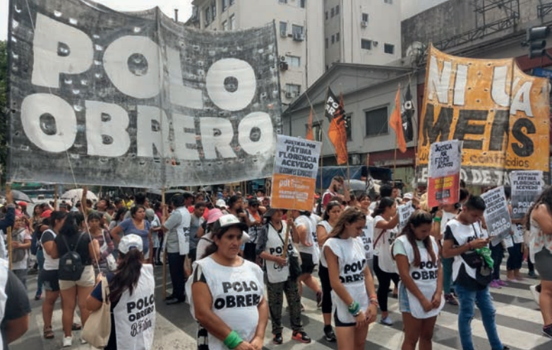
Concentración frente a la Casa de Entre Ríos en Buenos Aires