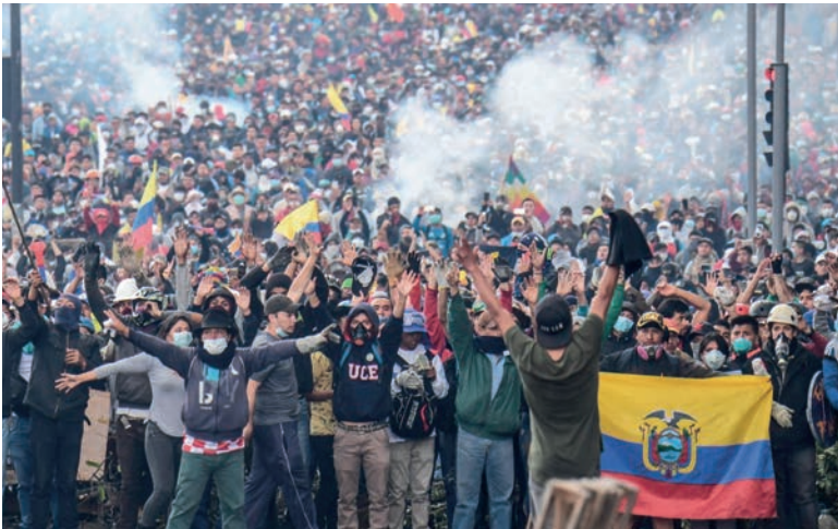
El ciclo de rebeliones inaugurado el año pasado está lejos de apagarse

Esta trayectoria contrasta con el escenario reinante en América Latina, donde lo que ha primado es la colaboración de clases. Dicha estrategia se ha revelado como un escollo central para conducir la lucha a una victoria. La izquierda latinoamericana mayoritariamente ha terminado siendo arrastrada como furgón de cola de esta política. Ha hecho un seguidismo al PT brasileño o al nacionalismo bolivariano, o terminado haciendo causa común con la derecha en nombre de la democracia. Ha primado el electoralismo y las tendencias al movimientismo, que incluye la tendencia a disolverse en partidos con fronteras de clase difusa, como el PSOL en Brasil, en lugar de la construcción de partidos obreros revolucionarios.