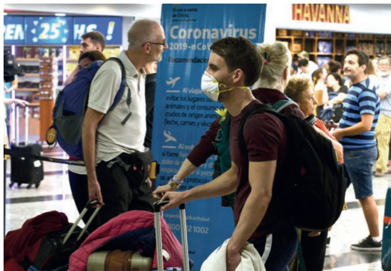
En Argentina, todos los elementos que favorecen el desarrollo de la epidemia están más que presentes

Entre Italia, España, Francia, Alemania y Estados Unidos suman más de 18 mil casos. La expansión de la enfermedad de China al “mundo occidental” no fue inmediata, pasaron semanas. Trump mismo fue acusado de no actuar rápidamente e improvisar medidas. Lo cierto es que la propagación en alza en los países capitalistas más desarrollados está favorecida por varias razones: una es la reducción de gastos del Estado en la salud