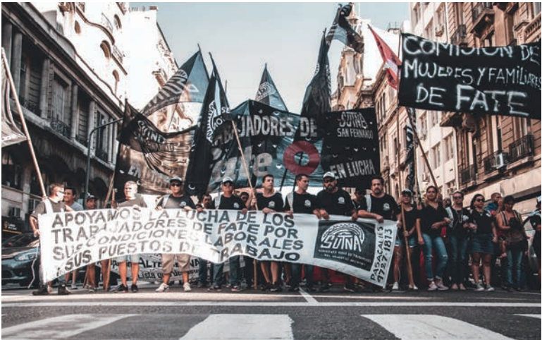
Un triunfo que reafirme al clasismo en la dirección del Sutna reforzará la lucha de todos los trabajadores

Un dato de suma importancia de la campaña es que el debate no solo se desenvuelve por la gran actividad desplegada por los activistas de la lista Negra. Decenas de trabajadores se suman con sus redes sociales y en cada sector o descanso, para explicar la importancia que tiene un voto masivo a la dirección clasista del gremio. La lista Negra ha colocado en el centro del debate lo que significa para los trabajadores defender, unir y fortalecer la organización independiente frente a las patronales y el Estado. El cuadro de discusión permanente que se vive en las plantas del neumático ha colocado a la campaña de la Violeta en la marginalidad. Se han mostrado completamente incapaces de entablar una discusión con los trabajadores, evadiendo las polémicas en todos los lugares de trabajo. Por lo pronto, sólo se han dedicado a difundir provocaciones y mentiras alevosas que aumentan el repudio entre los trabajadores. También continúan intentando por la vía del ministerio de trabajo poner palos en la rueda a la elección, sin ningún resultado. Todas medidas desesperadas para intentar amortiguar el derrumbe.