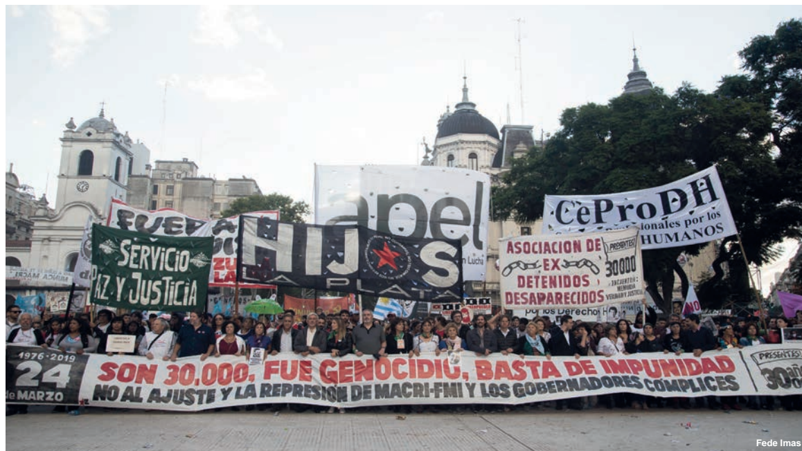
La “vuelta de página” de Fernández es inaceptable para el pueblo argentino porque implicaría una reforzamiento del aparato represivo

El recoge un planteo de “reconciliación” con las fuerzas armadas, que vienen levantando los sucesivos gobiernos para recuperar el rol del ejército en la vida política nacional, incluido su rol represivo. El Estado, a través de las policías (federal o provinciales), la gendarmería y la prefectura siguen ejerciendo su rol represor contra los reclamos y luchas populares (que fue lo que la dictadura quiso terminar con