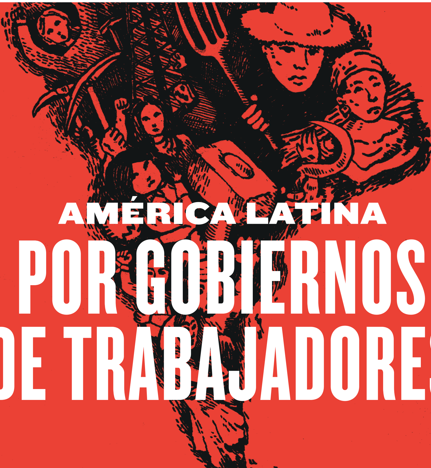
Ilustración: Julieta Farfala