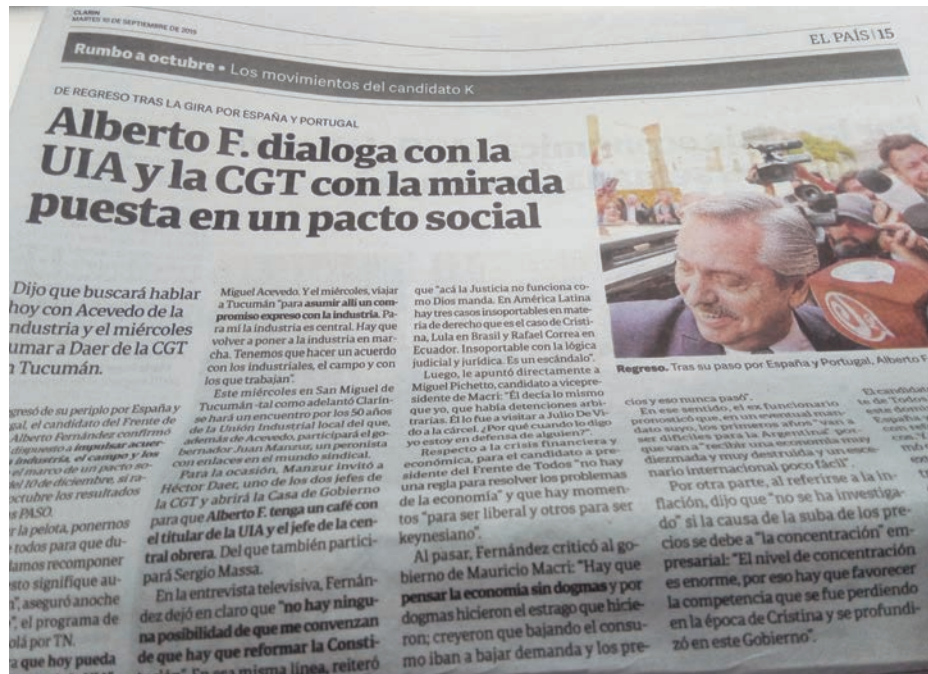
Facsimil del diario Clarín (10/9). Fernández postula un acuerdo de congelamiento de precios y salarios, donde lo que en verdad se congelarán son los salarios, con la complicidad de la burocracia sindical.

Los bomberos de la CGT salieron prontos a ficcionar actividad para mejor garantizar la tregua -en la que están todos los sectores de la burocracia sindical tributarios de Alberto Fernández, incluyendo a Moyano, Yasky y compañía.