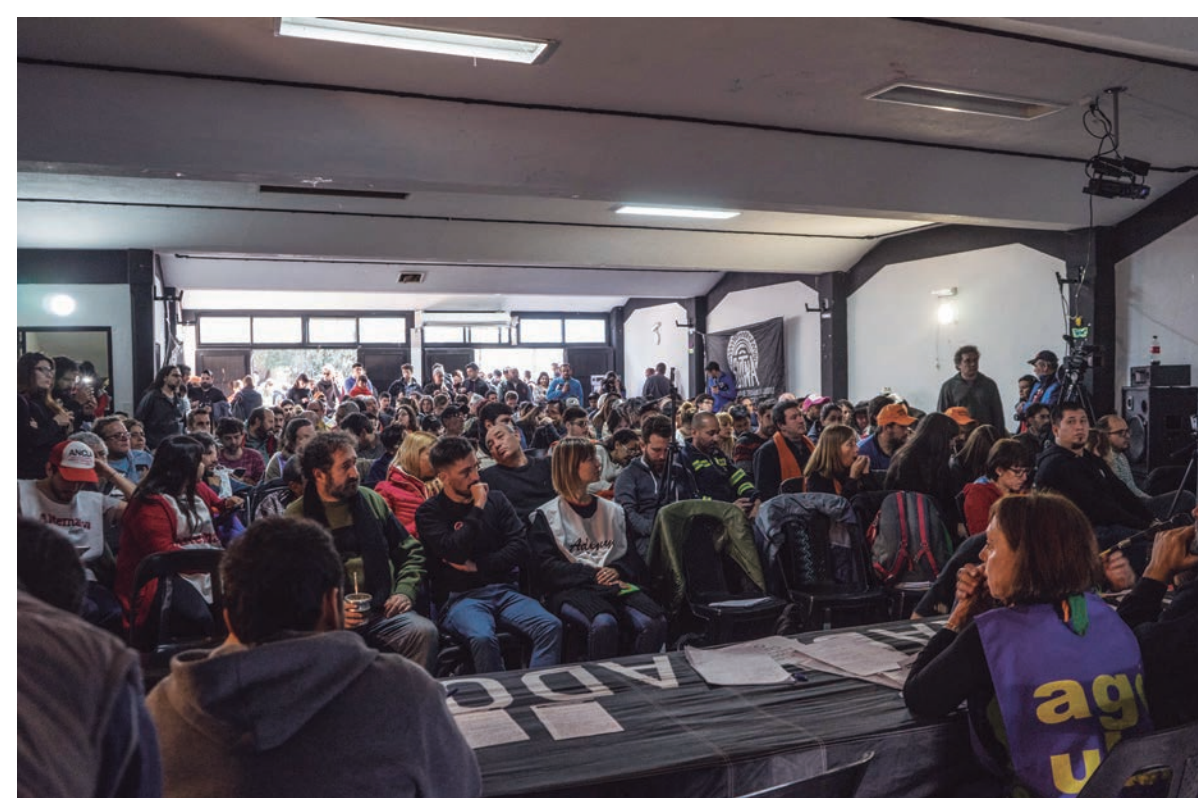
El 7 de septiembre se realizó una reunión preparatoria para organizar el Encuentro