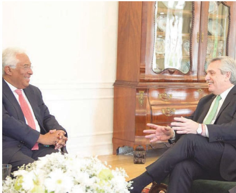
Fernández junto al primer ministro Antonio Costa. El modelo de ajuste portugués que reivindicaban los K produjo la emigración del 7% de la población

La Troika -el trío formado por la Unión Europea, el Banco Central Europeo y el FMI- otorgó un descomunal crédito de 78.097 millones de euros al país lusitano en 2011. Las reformas pedidas arrancaron de movida con una reducción de los salarios nominales del 7%, que fue a parar directamente a las arcas del Estado mediante un aumento del 18% en los aportes obreros que se descuentan del salario. Una rebaja nominal del tipo de la aplicada por Cavallo en 2001. Pero, en verdad, este ajuste fue aplicado por el gobierno derechista de Pedro Passos Coelho. El actual gobierno de Antonio Costa, una alianza entre el Partido Socialista y el PC, asumió recién en 2016 y ocho años después volvió el salario mínimo a los 485 euros, o sea al misérrimo punto de partida de ocho años atrás, en un nivel paupérrimo, de los más bajos de toda Europa de acuerdo con el costo