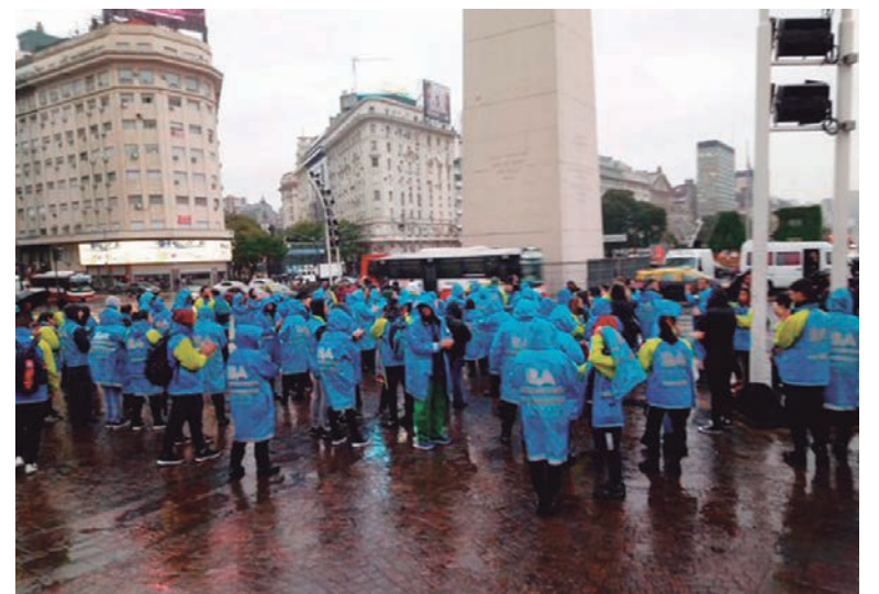
Cinthia trabajaba hace 6 años como monotributista, un fraude laboral ampliamente extendido en el gobierno de la Ciudad

Las patronales y sus gobiernos buscan explotar aún más al trabajador para descargar la crisis sobre su espalda. Es por eso que tanto Macri como Alberto Fer-