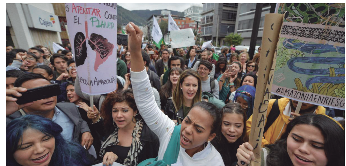
Está planteada una acción internacional: ganar las calles contra la política predatoria de los Bolsonaro, Macri y todos los gobiernos capitalistas.

Algunas potencias imperialistas -el presidente francés Macron, etc.- han salido a plantear -frente a la inoperancia criminal de Bolsonaro que deja avanzar los incendios- la necesidad de discutir "si es posible definir un Estado internacional para el Amazonas". Bolsonaro ha respondido declarándose defensor de la soberanía brasileña y... permitiendo que continúe el desmonte del Amazonas. Trump, en cambio, apoya abiertamente a