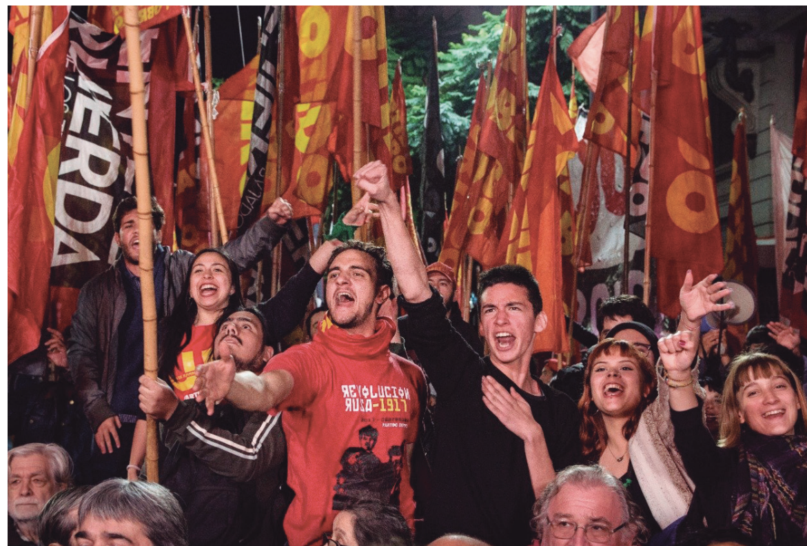
La izquierda ha tenido un retroceso en estas elecciones.

El por ahora macrista diario "Clarín" se preguntó sobre por qué cuando el macrismo se hunde en el país logra, sin embargo, ganar en las elecciones de los centros de estudiantes. Se trata de una presentación