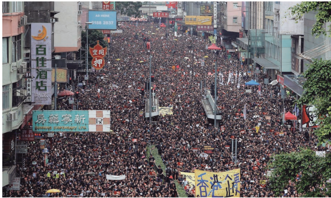
La movilización ha incorporado en su agenda el retiro de los cargos y procesos contra los manifestantes y la renuncia de la gobernadora.

La huelga coincidió con el reinicio del ciclo lectivo. Los estudiantes secundarios y universitarios, que paralizaron las clases