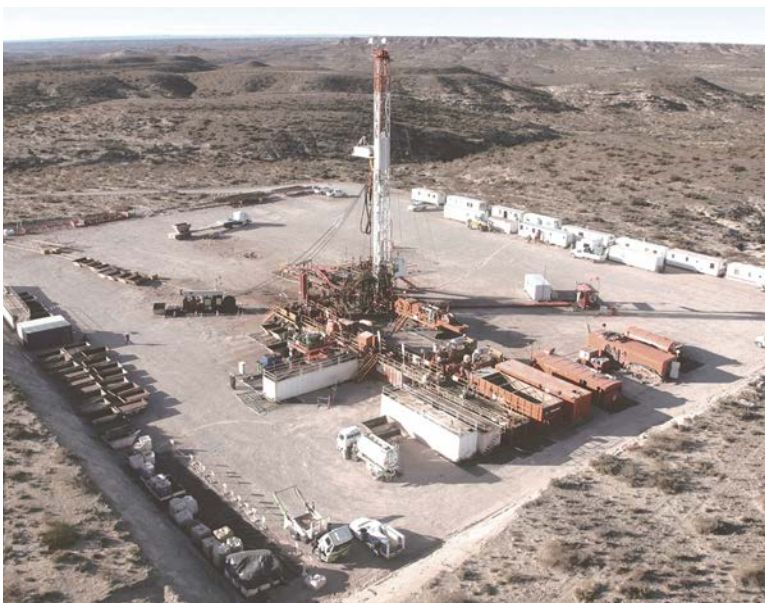
La política energética de los Fernández es tan inviable como la planteada por el macrismo.