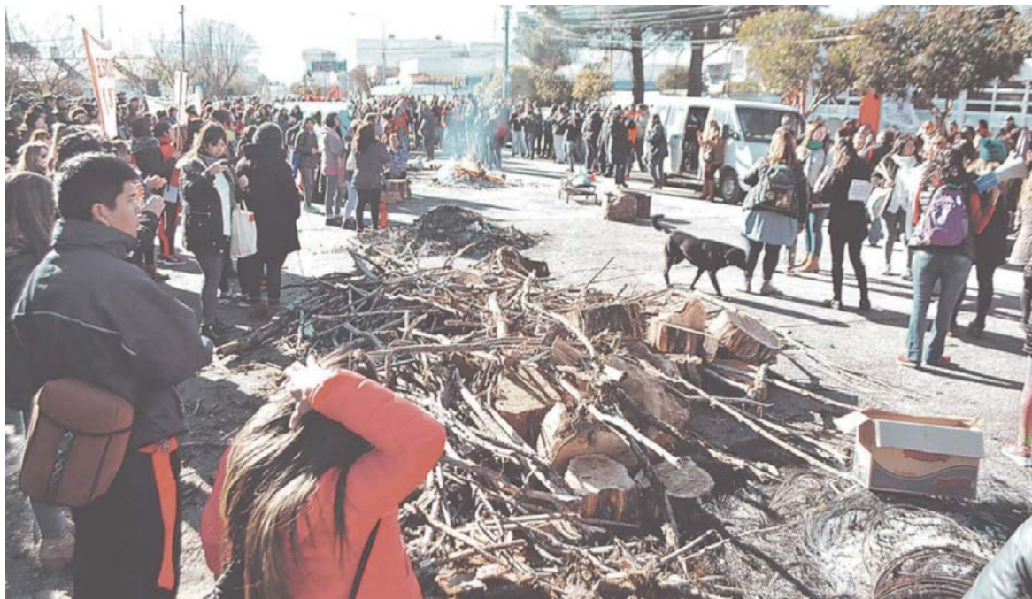
Se baraja una reestructuración de la deuda y los atrasos salariales desataron varias huelgas.

En relación con la deuda, por estos días la agencia Bloomberg publicó un artículo sobre la posibilidad de una “reestructuración” anunciada por funcionarios provinciales, que retomó Perfil ; el periodista Jorge Asís emitió un tweet que sugiere la llegada de una “cuasi-moneda” a la provincia; la calificadora Barclays emitió un informe donde se refirió a Chubut en términos explosivos: la necesidad de financiamiento de Chubut es 12 veces superior a sus ingresos corrientes, y a su vez, junto a la provincia de Buenos