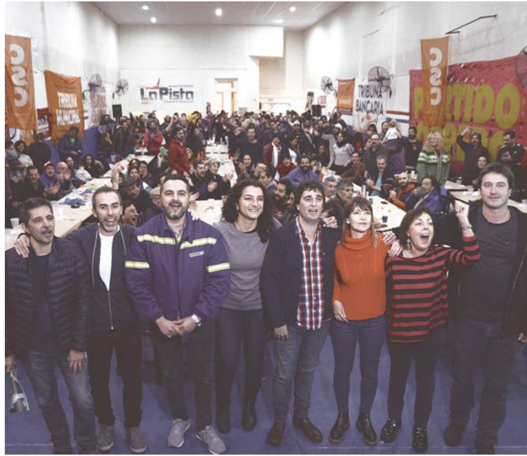
Asado de la Coordinadora Sindical Clasista en Capital Federal

Este avance patronal se apoya en la tregua reforzada de la burocracia, que tiene diversas expresiones, pero es común a todas sus alas. Los "combativos" del Frente Sindical para el Modelo Nacional (Fresimona) se reunieron en la sede del Smata para debatir "el rol de la dirigencia en el trance electoral" y los medios destacaron "el sesgo propositivo de la reunión" que "buscó ratificarle a Macri que no incurrirá en acciones de protesta". Esto cuando arrasan los despidos y suspensiones, en es-