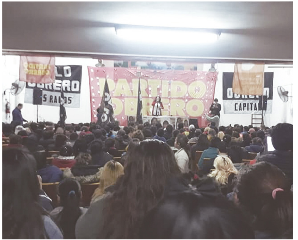
TUCUMAN. Participaron más de 350 compañeros