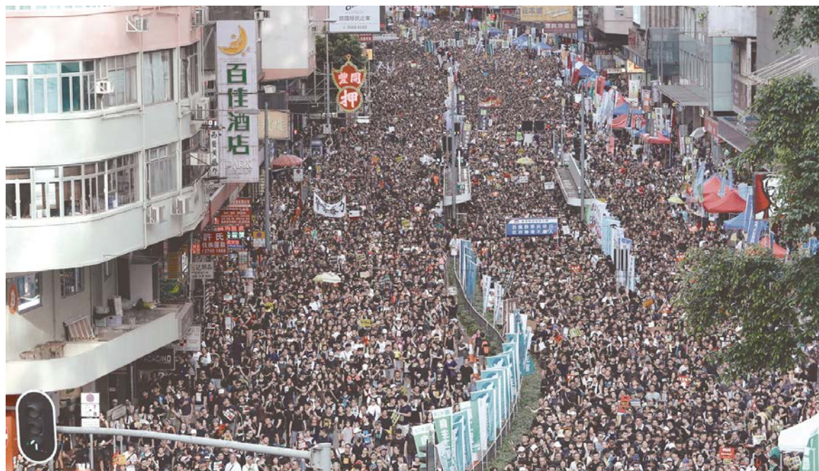
El peligro de un efecto contagio es lo que explica la creciente preocupación del gobierno chino.

Importa destacar que los auxiliares de la tripulación de a bordo de los aviones al igual que el personal del aeropuerto se sumaron a la concentración. Uno de los sindicatos que pertenece a la aerolínea más grande de Hong Kong, impulsó la protesta, desafiando