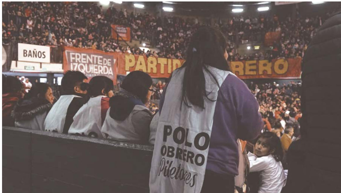
La intervención en la campaña electoral del Polo Obrero no registra antecedentes en sus casi veinte años de historia