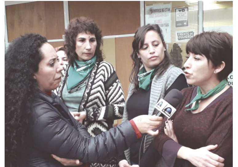
Una condena representaría un golpe a todos los luchadores.

La criminalización que están atravesando los compañeros es por el reclamo realizado en la jornada del 27 de septiembre de 2018 en defensa de la caja jubilaria. Lo que la Justicia llama “perturbación” no fue ni más ni menos que la defensa de los derechos jubilatorios de todos los trabajadores municipales. La querrela constituida por el intendente de Cambiemos, Horacio “Pechi” Quiroga, fue la que impulsó la denuncia y también la continuidad del legajo, aportando testimonios parciales y haciendo de esta causa no sólo una persecución hacia los trabajadores municipales y los luchadores, sino también un intento de impedir que Jure asuma como diputada provincial el próximo 10 de diciembre. Para Quiroga, una oposición política como la que desplegó la compañera tiene que