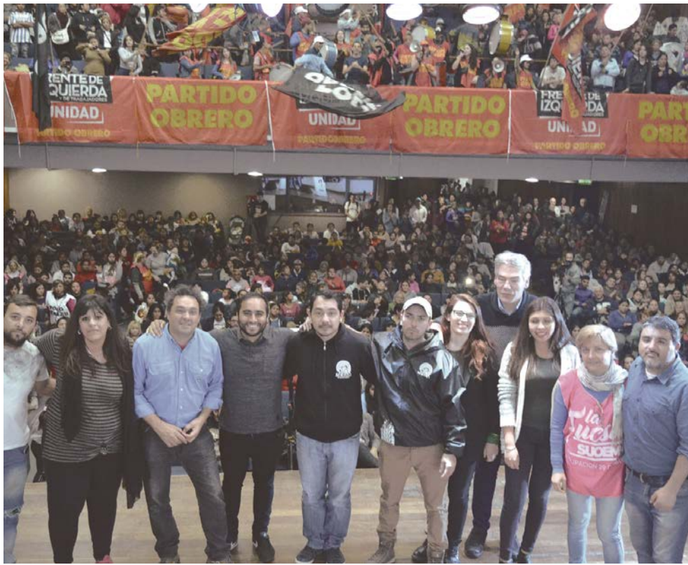
CORDOBA. 1.300 compañeros se reunieron en el sindicato Luz y Fuerza