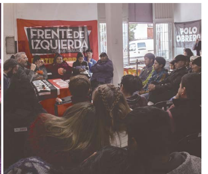
SALTA. Inauguración de local