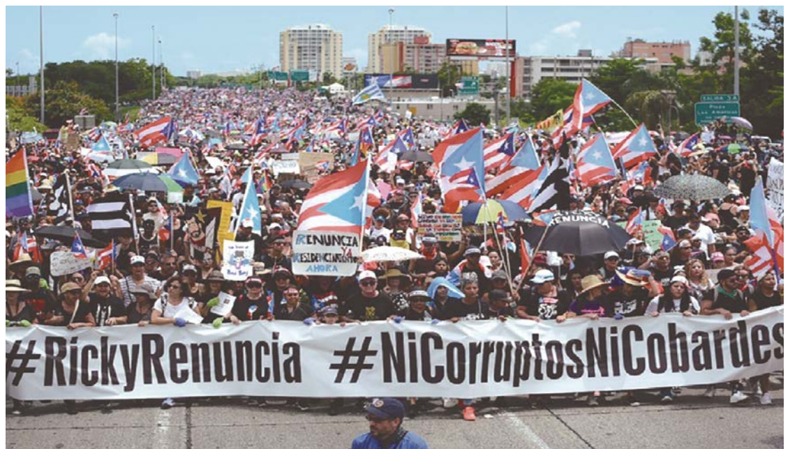
El pueblo boricua, un ejemplo para una Centroamérica encendida.

Fruto de las protestas masivas, el gobernador portorriqueño “Ricky” Roselló anunció su renuncia, que se hará efectiva el 2 de agosto.