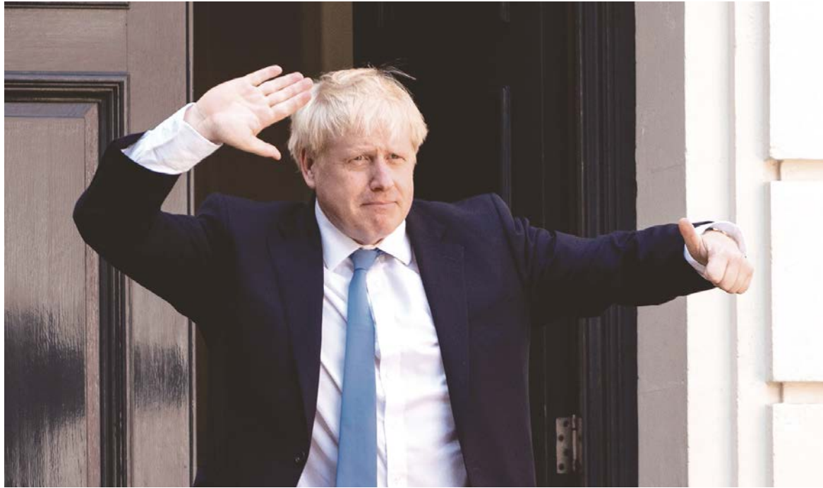
El Brexit ha mostrado las tendencias a la disgregación de la Unión Europea y dentro del propio Reino Unido.

armas para enfrentarse a los negociadores europeos. Señala que puede usar los 35 mil millones de euros que el Reino Unido debe desembolsar al momento de partir como herramienta de presión. Y reclama que se elimine la salvaguarda que impide el resurgimiento de una frontera dura en Irlanda -cláusula que enchaleca al Reino en la unión aduanera hasta hallar una solución a ese problema- para retomar negociaciones. Esa dureza por parte de Johnson es clave para mantener el apoyo político del DUP norirlandés, que cuestiona dicha salvaguarda y teme que, como fruto de las negociaciones, el territorio quede separado del resto del Reino.