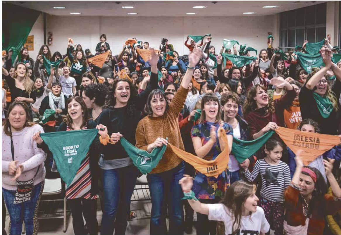
El FIT-U ha colocado las reivindicaciones de la mujer trabajadora en primera plana.

Ninguno de ellos puede ofrecer un programa que atienda los derechos de las mujeres trabajadoras, que somos una mayoría que vive precarizada o con ingresos de convenio que consagran la pobreza como ocurre con el millón de empleadas domésticas. El quintil más pobre de nuestra sociedad está formado en un 70% por mujeres, con una brecha salarial del 43%. La continuidad del pacto