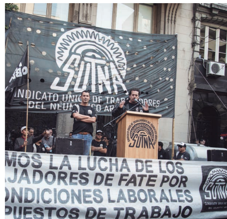
Los trabajadores de Fate llegan al final de esta primera etapa de lucha en el punto más alto de su organización

Las negociaciones abiertas con la patronal han sido inútiles frente a la intransigencia de los planteos patronales. La negativa de la patronal a encaminar algún tipo de salida debe ser tomada como una nueva alerta para el conjunto de los trabajadores de Fate. El plan inicial de esta patronal fue dejar en la calle a más de cuatrocientos compañeros e imponer un nuevo cuadro de explotación y flexibilidad laboral. El horizonte patronal desde el principio fue el intento de recuperar el conjunto de los métodos de producción en la fábrica. Hoy, luego de años de lucha, cada