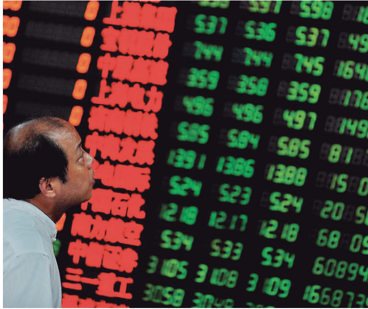
La crisis de sobreproducción unida a un endeudamiento explosivo ha terminado por inviabilizar la política monetaria

Este punto de inflexión de la economía china se da en medio de una desaceleración global, en momentos en que se anuncia un crecimiento anémico de Europa de apenas el 1 por ciento, encima sacudida por el Brexit que afectaría negativamente no sólo a Gran