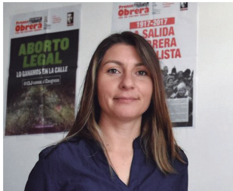
“El pago de la deuda es incompatible con el desarrollo de la provincia”, declaró la candidata del Frente de Izquierda