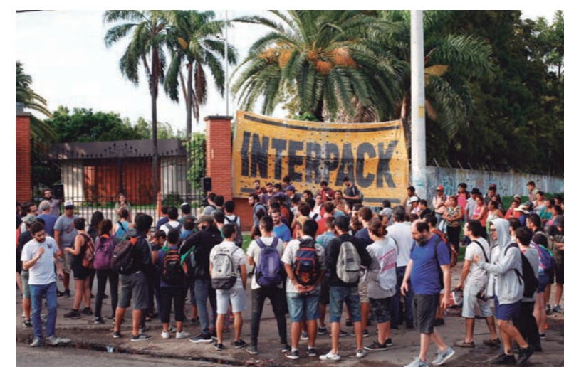
Los obreros vienen de 63 días de acampe y 32 de ocupación contra los despidos

En condiciones muy difíciles, con una planta muy reducida (producto fundamentalmente de jubilaciones y jubilaciones anticipadas) libramos la lucha más dura de cuantas hemos protagonizado en estas dos décadas: 63 días de acampe y 32 de ocupación, con movilizaciones, cortes y bloqueos.