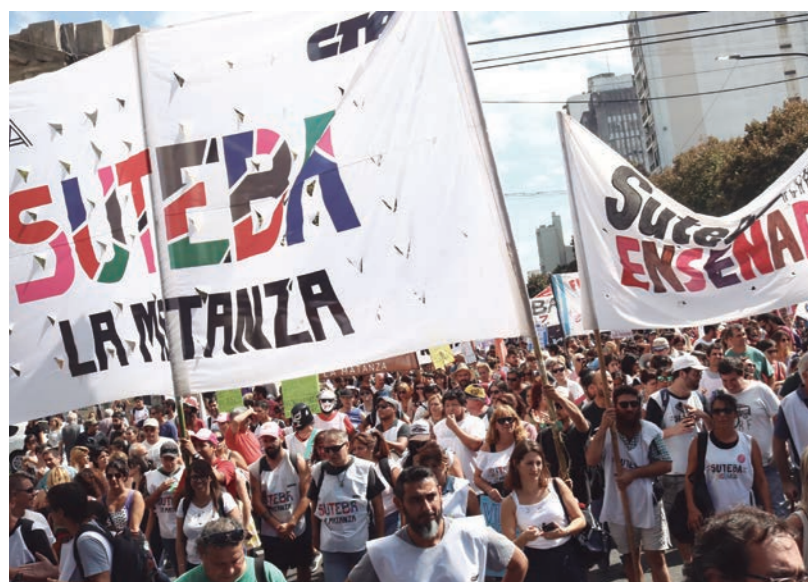
Es imprescindible convocar ya a parar el 28 y 29 de marzo con continuidad