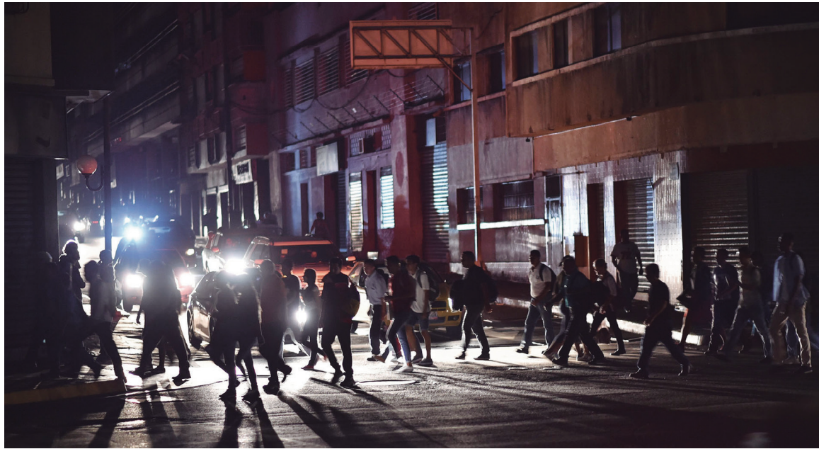
Estamos frente a un impasse político, donde la derecha no puede provocar un desenlace

De todos modos, y aún admitiendo la versión del gobierno, es imposible disimular la bancarrota