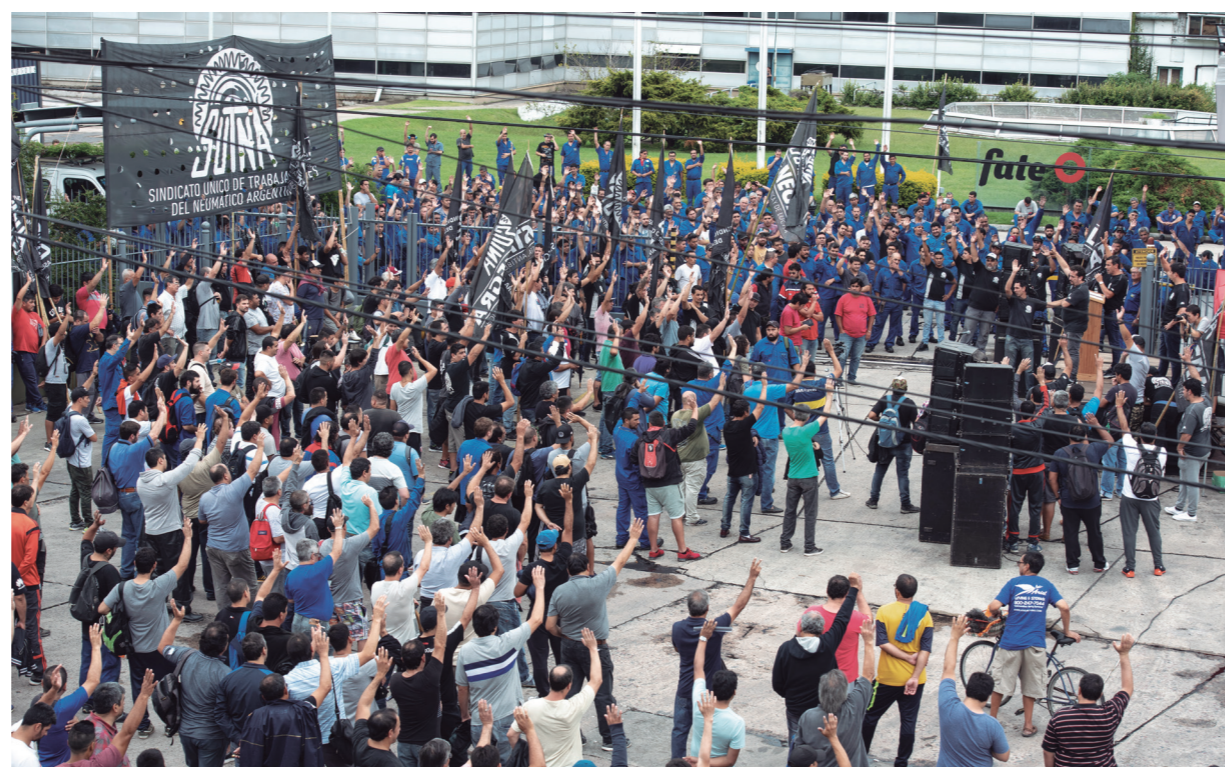
La asamblea votó masivamente el rechazo al procedimiento preventivo de crisis