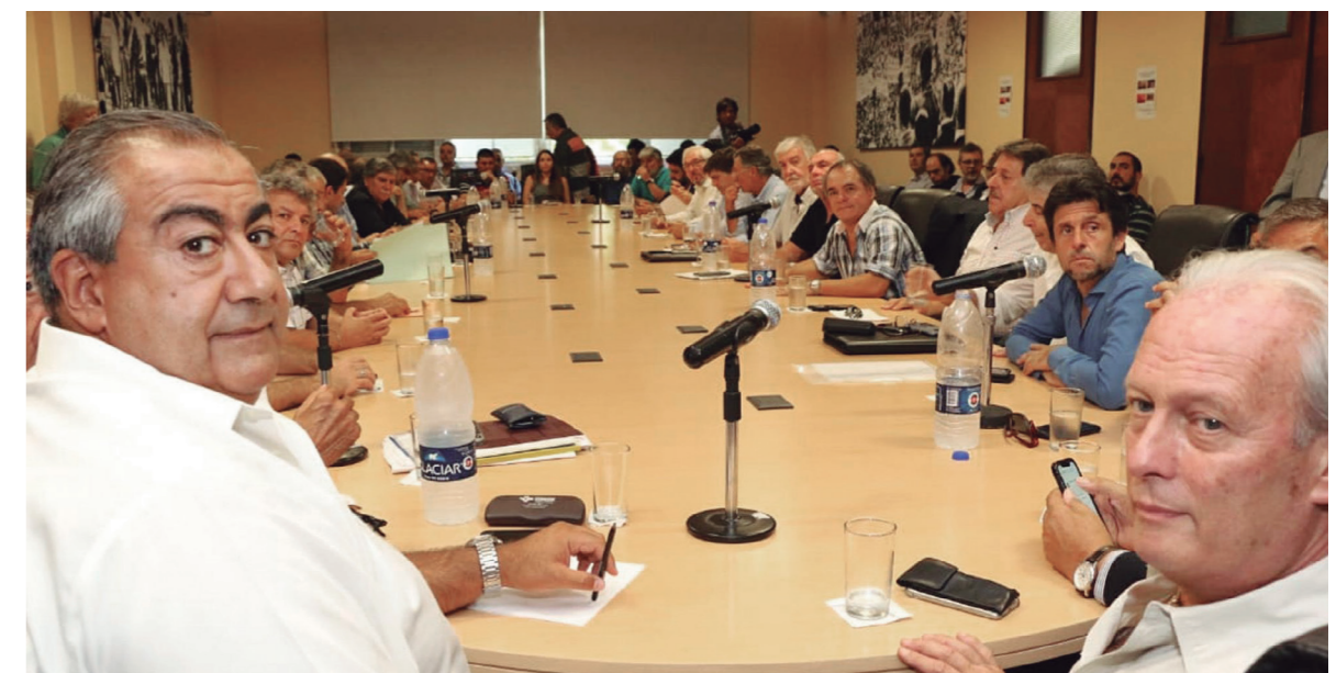
Todas las fracciones de la burocracia marchan a una confluencia en la interna del PJ