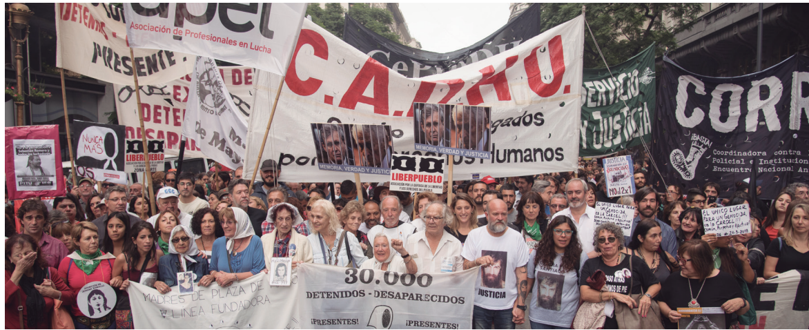
Este 24 de Marzo, como todos los años, va a ser una jornada de lucha.

La profundización de la represión y la criminalización de la protesta constituyen el complemento de los acuerdos que el gobierno teje con el pejota y los gobernadores para hacer pasar el ajuste y sus leyes. Los crímenes de Santiago Maldonado y Rafael Nahuel en la Patagonia; el enaltecimiento del "gatillo fácil" del policía Chocobar como "doctrina" de seguridad y el mayor entrelazamiento del aparato represivo local con los del imperialismo forman una unidad política con la reivindicación de las Fuerzas Armadas y de la dictadura misma en boca de numerosos funcionarios. Durante la cumbre del G20, Patricia Bullrich sancionó el "protocolo de gatillo fácil" e impulsó la utilización de las picanas portátiles Taser.