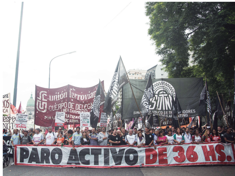
El pacto con el FMI, con sus ajustes permanentes para pagar la deuda, ha fracasado a la vista de todos

La salida a la crisis reclama una transformación social integral: hay que parar los despidos repartiendo las horas de trabajo, hay que romper con el FMI, repudiar la deuda externa usuraria, parar la fuga de capitales nacionalizando el sistema financiero, proceder a terminar con el régimen de las privatizadas y los monopolios petroleros, nacionalizando bajo control obrero los recursos naturales del país, establecer el monopolio del comercio exterior, abrir los libros de las 101 empresas contratistas de la obra pública y asegurar la continuidad de las obras mediante la intervención del Estado bajo gestión y planificación de los trabajadores. Elevar el salario a una ca-