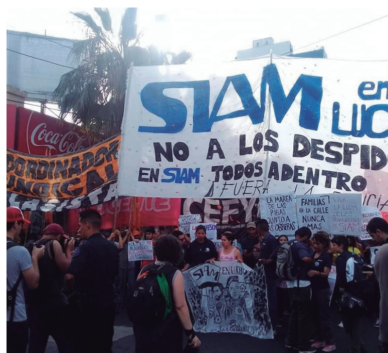
Los despedidos son la antesala de una mayor flexibilización laboral en la planta

curridas, cortes y movilizaciones en el Puente Pueyrredón y en el centro porteño, un abrazo reciente en la puerta de fábrica que valió una importante demostración de solidaridad de los trabajadores de Siam que están dentro de planta y, por último, la concentración en el Ministerio de Trabajo en La Plata. Este jueves se realizará un corte en el Puente Pueyrredón y una nueva movilización el viernes a la capital bonaerense.