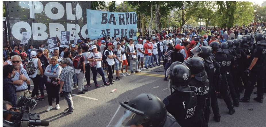
El 5, más de diez mil piqueteros rompieron el cerco policial ordenado por el gobierno

ciones sociales pejuta-kirchneristas ligadas a la Iglesia transita sobre el volcán de la inflación galopante en los alimentos y sobre la insuficiencia de los 450 mil planes sociales, cuando entre desocupados y subocupados se superan los tres millones. Pero la cuestión del hambre y la desocupación, cuando la crisis argentina tiende a empalmar con una recesión a escala mundial, no se resuelve en una navidad sin estallido. Atravesará cada semana del año electoral 2019. Precisamente, la cuestión del voto 2019 a la incierta unidad opositora “antimacrista” es un arma esgrimida por quienes postergan las reivindicaciones y evitan una lucha general contra el gobierno.