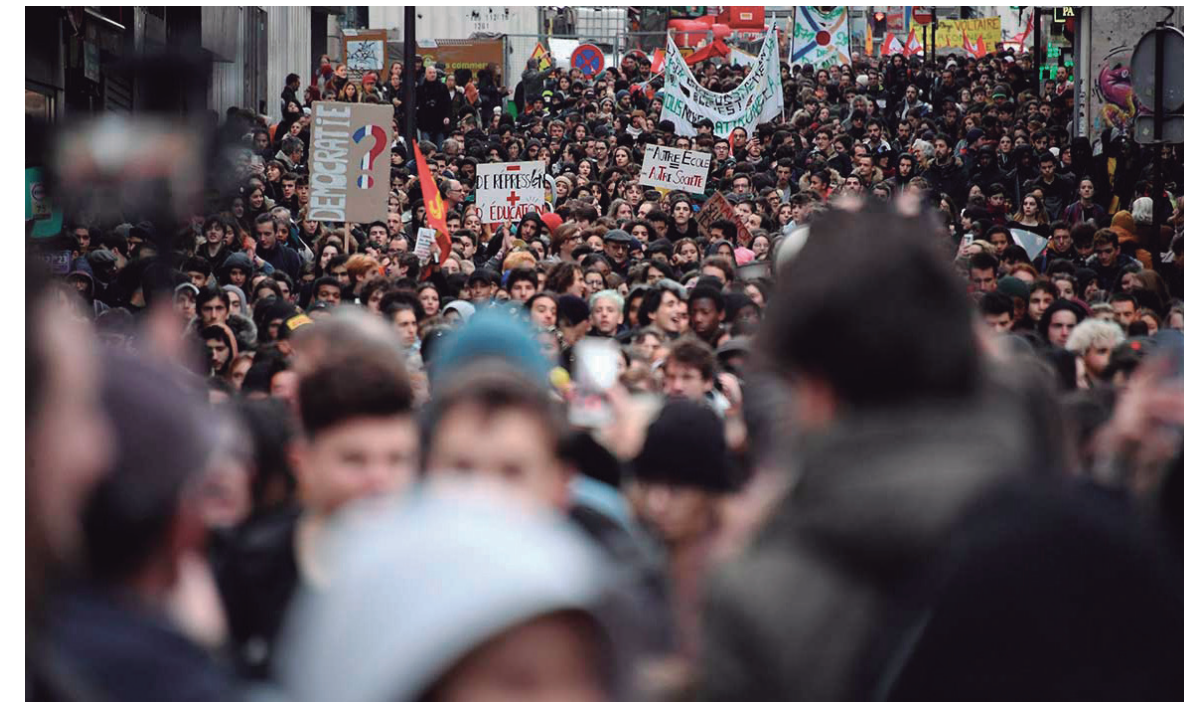
El llamado a una huelga general con un programa definido plantearía, objetivamente, una cuestión de poder

el encarecimiento de las naftas y el diésel. "La lucha en defensa del medio ambiente es también una lucha contra la desigualdad social", explicaron. La movilización de secundarios se incrementó, con la consecuencia de un número enorme de detenidos; fueron ocupados varios edificios públicos, en varios de los cuales se declararon huelgas, y se ha anunciado una huelga de camioneros y una manifestación de propietarios agrícolas. Los 'chalecos' volvieron a ocupar los Campos Elíseos, la zona vedada por el Estado, que las burocracias sindicales no se cansan de respetar. El Arco de Triunfo ha dejado de ser la zona reservada para el homenaje al militarismo francés.