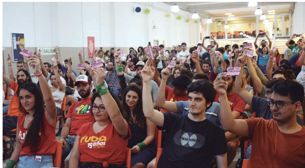
La Fuba que emerge de este Congreso será una federación en disputa

Tras el triunfo contra el macrismo y el Rectorado