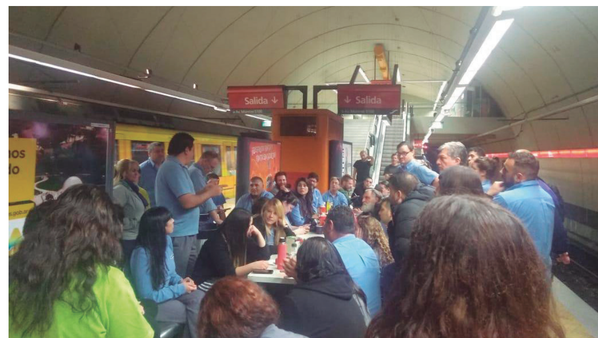
La Naranja del Subte ha dado una fuerte batalla por la constitución de este frente único.

La lista se ha definido, muy importante, por el rechazo al acta recientemente firmada por la conducción del sindicato, en la que se condiciona el derecho de huelga, la herramienta más preciada de los trabajadores del subte en su rico proceso de lucha contra la bu-