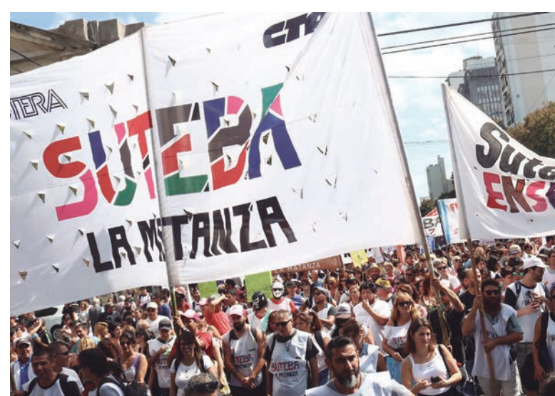
En la base docente las energías y la decisión de lucha sobran

Los docentes, rehenes de la paritaria a la baja de Vidal, Baradel y el Frente de Unidad Docente