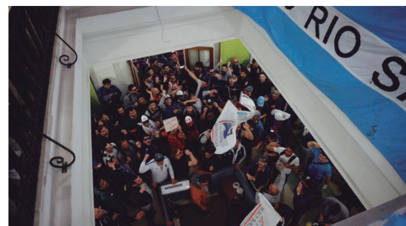
Tribuna del Astillero plantea una asamblea general para votar el mandato a la paritaria

impuesto por decreto un 2 por ciento de aumento a los docentes de Santa Cruz. Los que defienden este régimen mientras cacarean