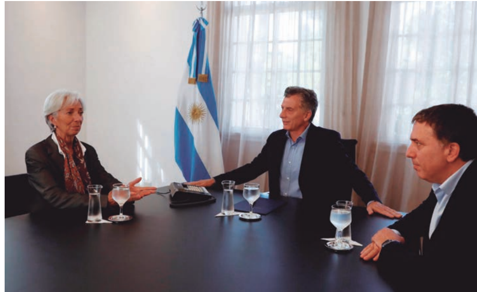
Desde el punto de vista de los trabajadores, el Presupuesto sólo puede ser rechazado

Todas las alas del PJ denunciaron no conocer los acuerdos secretos con el FMI, pero se movieron en torno al planteo de "rehacer" el presupuesto sobre "pautas realistas". El kirchnerismo colgó de sus bancas el cartelito "Presupuesto Rehacer". De manera que votará en contra, pero desde una postura similar a la de los que votarán a favor o se abstendrán, todo lo cual formará parte del complejo diseño de la entrega. El kirchnerismo vota en contra a sabiendas de que sus votos no impiden la aprobación. Ya se han ocupado sus voces de aclarar que el pacto con el FMI "condicionará" al próximo gobierno, o sea