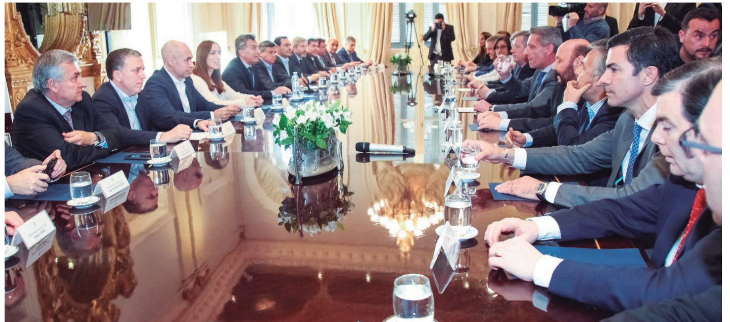
La aprobación del Presupuesto implica convalidar una política de empobrecimiento de los trabajadores y los jubilados

Los gobernadores ya han empezado a descargar el peso del ajuste sobre los trabajadores. La vía principal para ello son las paritarias a la baja, que afectan a estatales y docentes. La pérdida salarial promedio supera los 10 puntos, algo que opera sobre salarios ya de por sí muy ba-