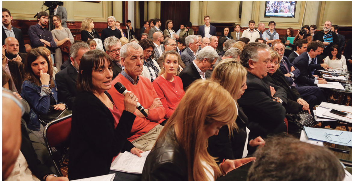
En la Bicameral, la diputada del PO-FIT señaló que la eliminación del Fondo Sojero es parte de las medidas de ajuste pactadas

Los gobernadores apoyaron posteriormente en el Congreso la reforma previsional reaccionaria -que le robó 100 mil millones de