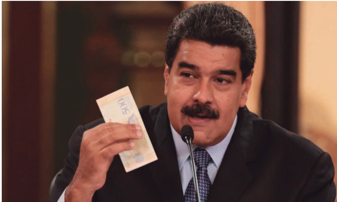
El giro económico protagonizado por el régimen puede significar un salvavidas de plomo

Venezuela está sacudida por el paquetazo puesto en marcha por el régimen bolivariano. El gobierno de Maduro ha dispuesto otra brutal devaluación del ;96%! La medida se produjo un día después de la re-conversión del “bolívar fuerte” al “bolívar soberano”, con la entrada en circulación de nuevos billetes que restaron cinco ceros a la moneda local. Estas medidas van acompañadas por la activación de un nuevo mercado cambiario que operará con una tasa única atada a la criptomoneda venezolana petro, cuya cotización estará determinada por el precio internacional del petróleo. De modo que un petro vale 60 dólares, el actual valor del precio del barril de crudo. Esto eleva el tipo de cambio de 2,48 a 60 bolívares soberanos.