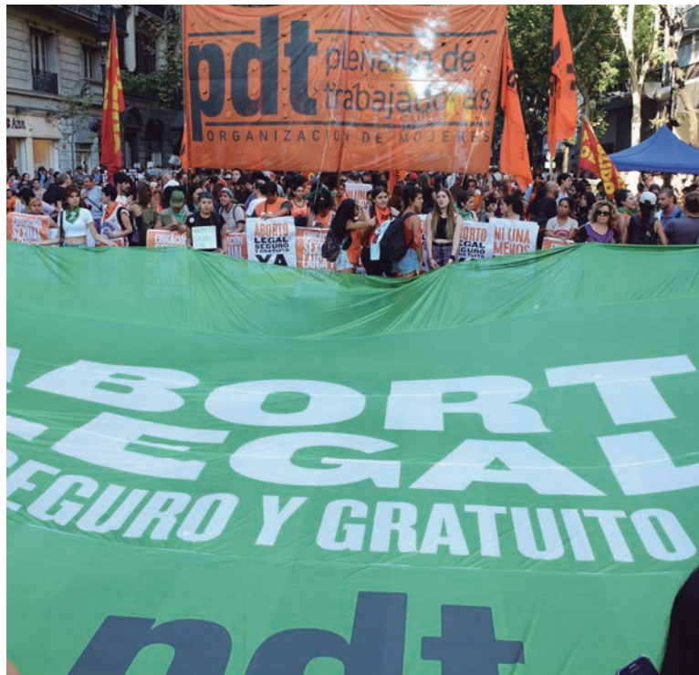
El ascendente movimiento de mujeres ha adoptado los métodos históricos de la clase obrera

El congreso deliberará respecto de la situación de las trabajadoras en nuestro país, caracterizada por un retroceso material y social de magnitud en los últimos 35 años, que explica la distancia brutal entre las condiciones materiales de vida de las trabajadoras y los pretendidos avances en el terreno político, como la paridad de género. Las burocracias sindicales de la CGT y la CTA, que no repudian el acuerdo con el