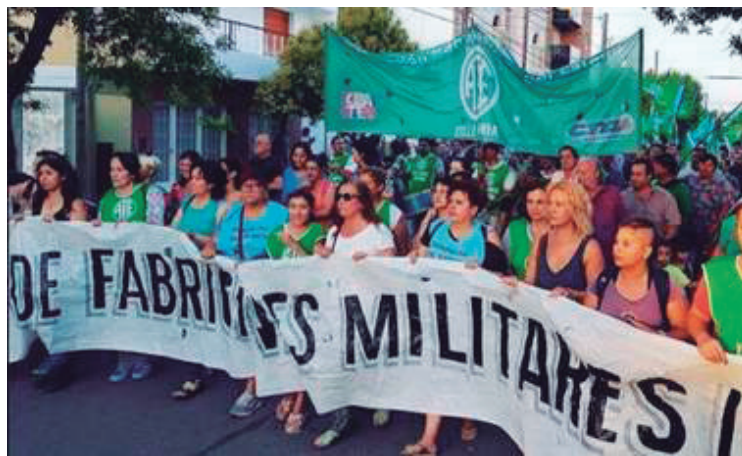
El gobierno pretende imponer más de cien despidos