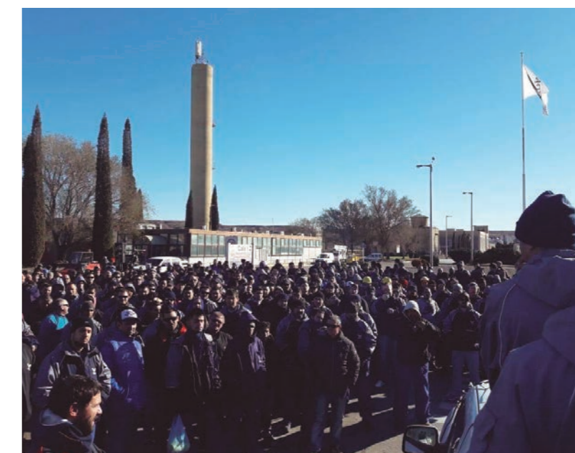
Los metalúrgicos de Aluar realizaron esta semana un paro total de 48 hs.

Una gran lucha contra los techos salariales