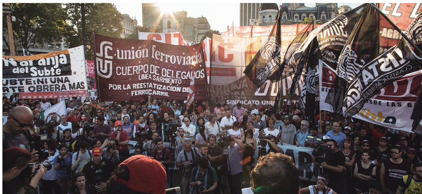
Más de treinta sindicatos y centenares de cuerpos de delegados participarán del Plenario Nacional de Trabajadores

Ninguna lucha del último período estará ausente, sea el Inti, Cresta Roja, la docencia universitaria de Conadu Histórica, los mencionados mineros del Turbio, los sindicatos docentes que no han cerrado su paritaria y la huelga general de Aluar, que se erige como una de las grandes luchas obreras del momento contra los techos paritarios. Los trabajadores de esa fábrica, una de las plantas industriales más importantes del país, desafían la paritaria de hambre firmada sin lucha por la UOM y desarrollan su huelga mediante asambleas