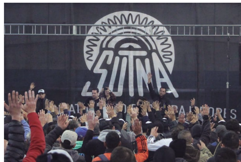
La metodología de definir el pedido salarial en asamblea general distingue al Sutna de los sindicatos burocráticos

Tras señalar los manejos fraudulentos por parte de la burocracia de Pedro Wasiejko (desplazada por la actual conducción en 2016), que dejó a la obra social con enormes