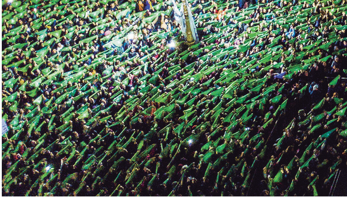
Presentar el derecho al aborto como una medida de “salud pública” es un reduccionismo equivocado

Los embarazos no deseados y muchísimos tipos de enfermedades tienen en común que con una política de prevención pueden reducirse significativamente -el embarazo no deseado, por ejemplo, con una política pública que incorpore la educación sexual y la difusión y entrega gratuita de anticonceptivos. Hasta aquí, entonces, la comparación es completamente legítima. Pero sólo hasta aquí. Sucede que una vez que una mujer está embarazada debe de-