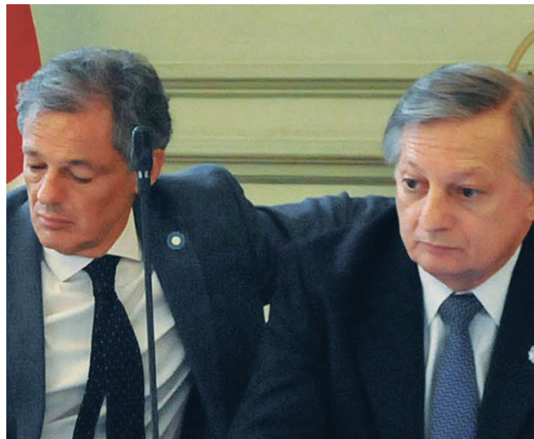
La crisis de gabinete es un intento de rescate del rodrigazo oficial y del propio acuerdo con el FMI

El nuevo ministro de la Producción, Dante Sica, comandó la Secretaría de Industria bajo los devaluadores Duhalde y De Mendiguren. En esa línea, ya anticipó que "habrá poco lugar para un nuevo atraso del tipo de cambio real" ( ídem , 17/6). La ofrenda del gobierno a la burguesía industrial es un régimen de de-