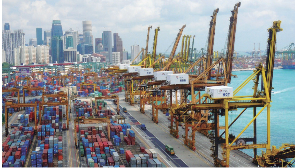
Detrás de la guerra económica desatada por la Casa Blanca hay un interés por avanzar con el proceso de apertura y colonización de la economía china

tea, además, un enfriamiento de la economía. En contraste con los pronósticos de una recuperación económica sólida, "los indicadores de actividad manufacturera y servicios han estado retrocediendo. Las ventas minoristas llevan tres meses consecutivos cayendo, los gastos en construcción se desaceleraron a comienzos de año y las ventas de automóviles se han estancado en gran medida" ( The Wall Street Journal , extraído de SWS, 14/4).