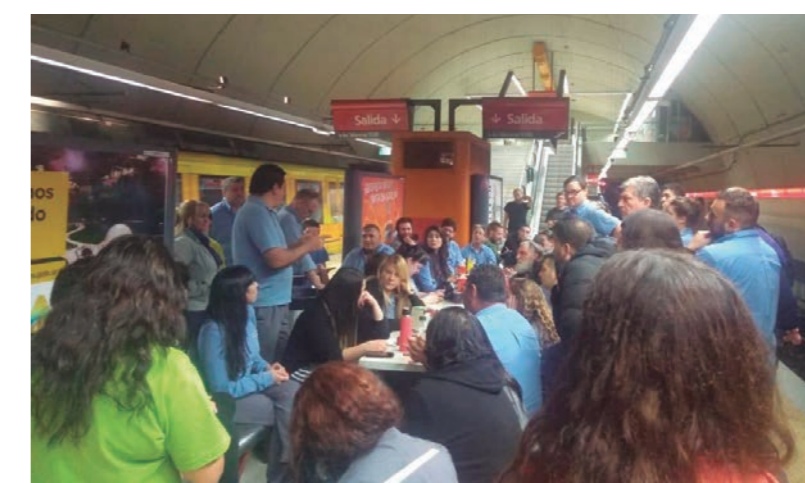
La resolución del juez Gallardo pretendió imponer una tregua en el conflicto totalmente favorable a la parte patronal

Desde que el juez Gallardo intervino en el conflicto del subte, la situación ha empeorado notablemente. El juez dictaminó que se abriera una mesa de negociación sobre la paritaria por un período de 60 días, que incluyera, además de la UTA, Metrovías y SBASE, a la AGTSyP. Que quedaran sin efecto las sanciones aplicadas y se devolviera el dinero descontado por las mismas, y que la AGTSyP, por otro lado, se abstuviera de tomar medidas gremiales durante ese lapso.