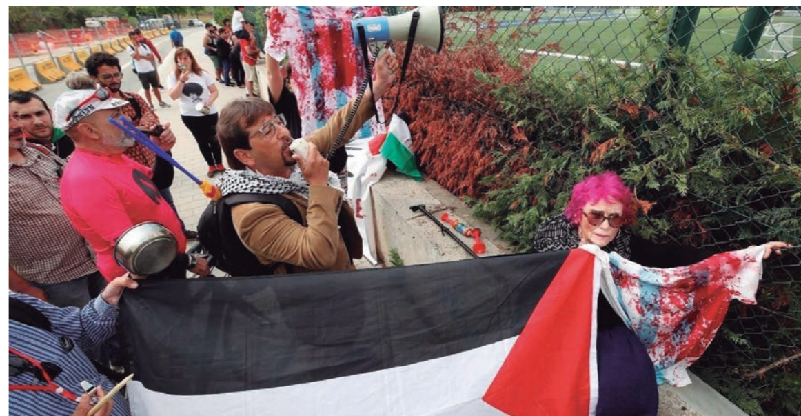
Netanyahu quiso usar el partido como parte de un operativo político de blanqueo de los asesinatos masivos de palestinos

Gran triunfo democrático contra el gobierno genocida israelí