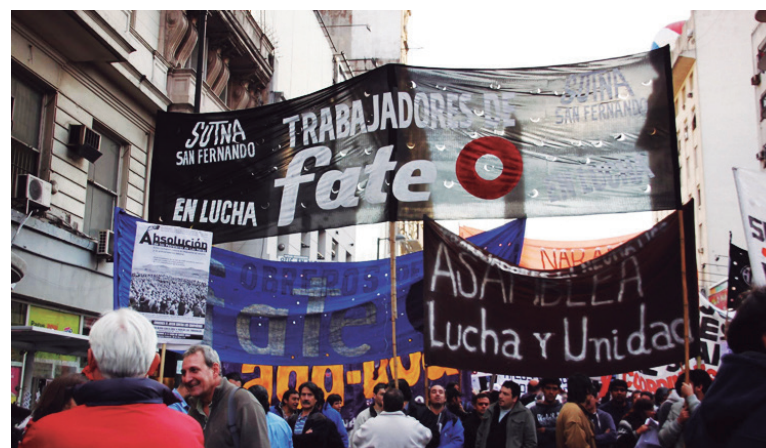
El dato principal de la elección ha sido la pulverización de la vieja burocracia de Wasiejko

El masivo apoyo a la Lista Negra en la fábrica más masiva del gremio y una de las más grandes plantas industriales del país es un respaldo clave a la nueva dirección clasista y sus métodos, en el marco de fuertes ataques a los trabajadores por parte del gobierno y las patronales. Los compañeros eligieron defender el rumbo trazado en la última etapa, donde la organización colectiva, sobre la base