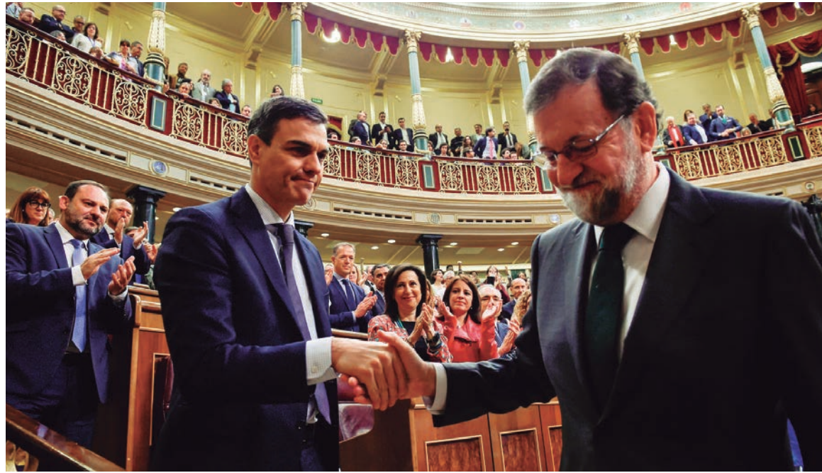
La renuncia de Rajoy es el indicador de una crisis de régimen

Ello fue posible gracias al apoyo de Podemos y del nacionalismo vasco y catalán. El argumento de Pablo Iglesias, al igual que el de Izquierda Unida (IU), es que lo prioritario era desembarazarse del PP y que cualquier cosa “sería mejor que lo que tenemos”. Pero