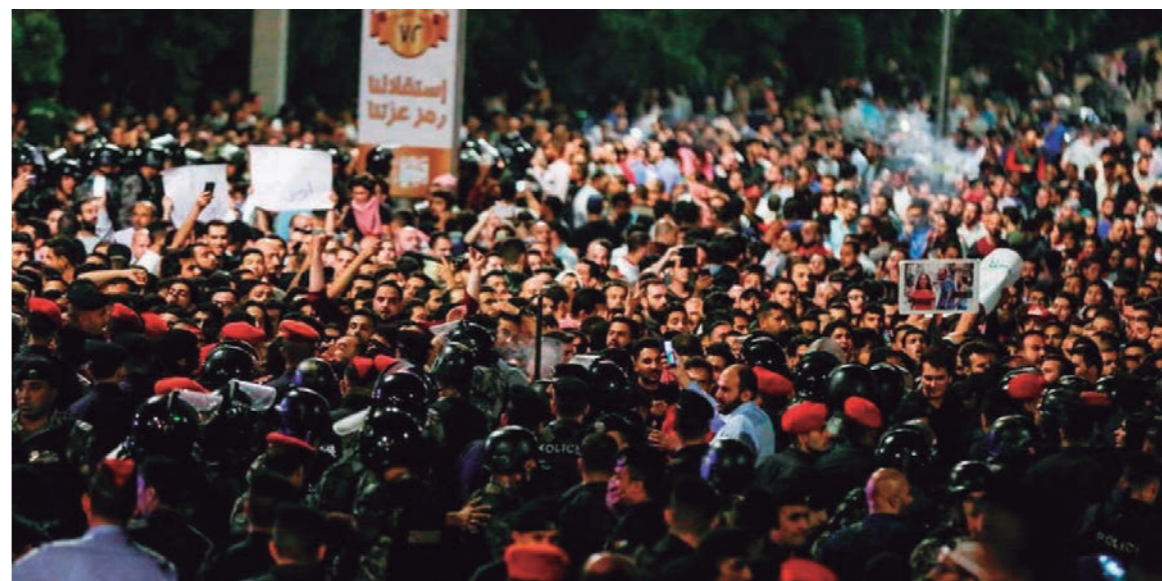
La rebelión se suma a los recientes estallidos en Túnez, Irán y Marruecos

El fantasma de la Primavera Árabe en las narices de Netanyahu