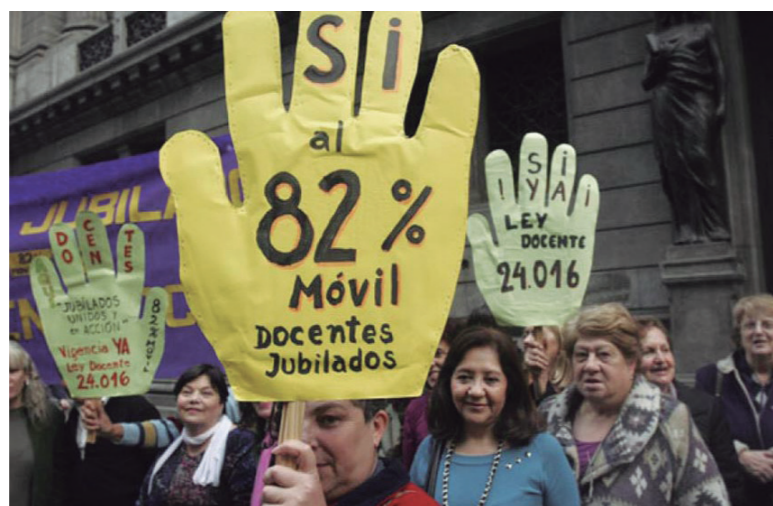
Los regímenes previsionales especiales fueron logrados por sectores de trabajadores por medio de una intensa lucha

Para que nada escape de los diseños oficiales, la comisión revisora de los regímenes especiales estará integrada, en su abrumadora mayoría, por funcionarios oficiales y solo se le habilitará una participación puntual a los sindicatos “con personería gremial”, es decir dirigidos por la burocracia, cuando se trate del