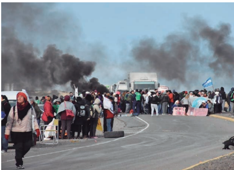
Los últimos gobiernos han conducido la provincia a un derrumbe económico con una deuda que representa el 100% de los ingresos provinciales