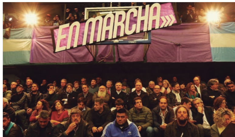
En Marcha apuntaría a integrarse, como socio menor, a un frente opositor liderado por el PJ

Como posible apéndice de una presentación electoral liderada por el pejota-Kirchnerismo, los oradores terminaron refractando las disiden-