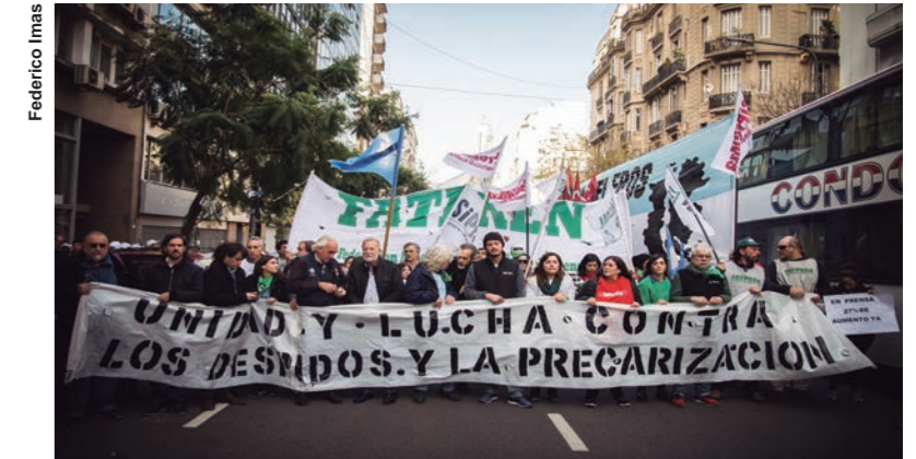
La convocatoria apuntó a denunciar la destrucción de puestos de trabajo en decenas de empresas periodísticas

Convocaron Sipleba, Fatpren y sindicatos de prensa de todo el país