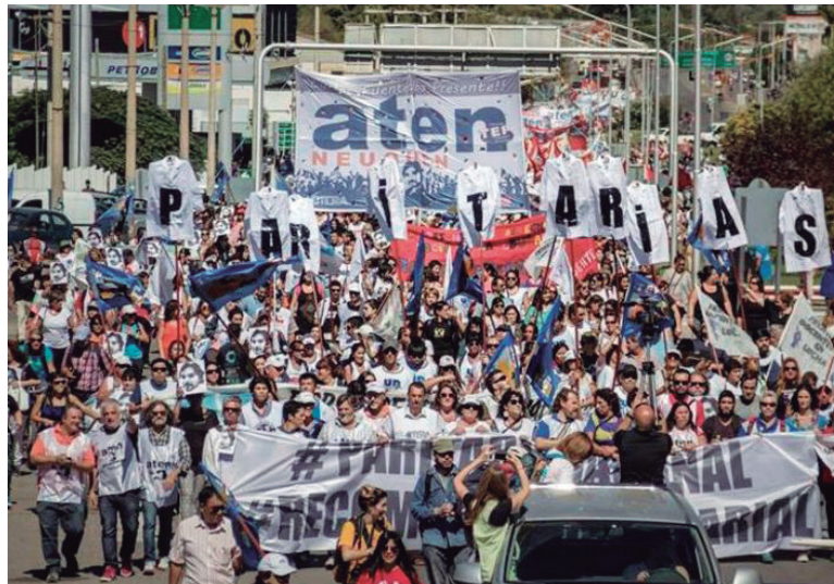
Sólo un paro activo que movilice millones desde sus lugares de trabajo puede poner la iniciativa política en manos de las masas trabajadoras

chas obreras que sacuden, aisladas, a todo el país.