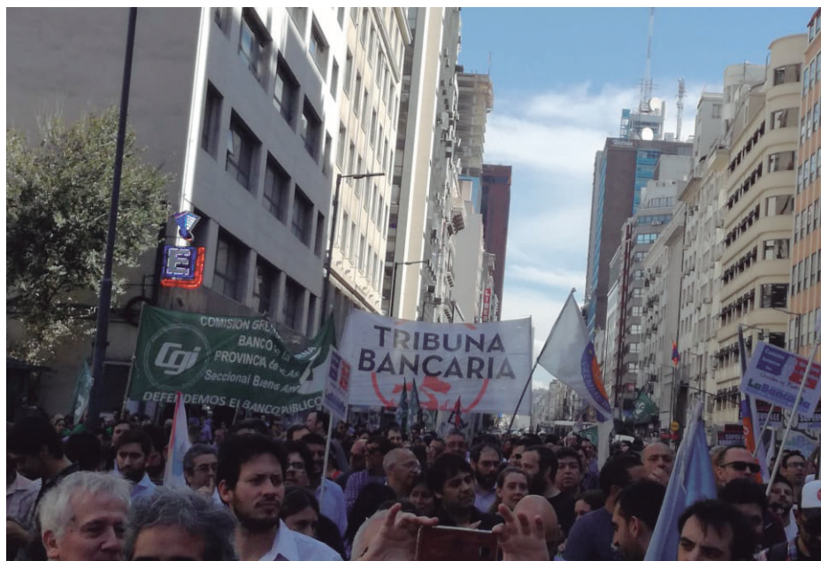
Hay reservas en el movimiento obrero para quebrar el ahogo de la burocracia sindical