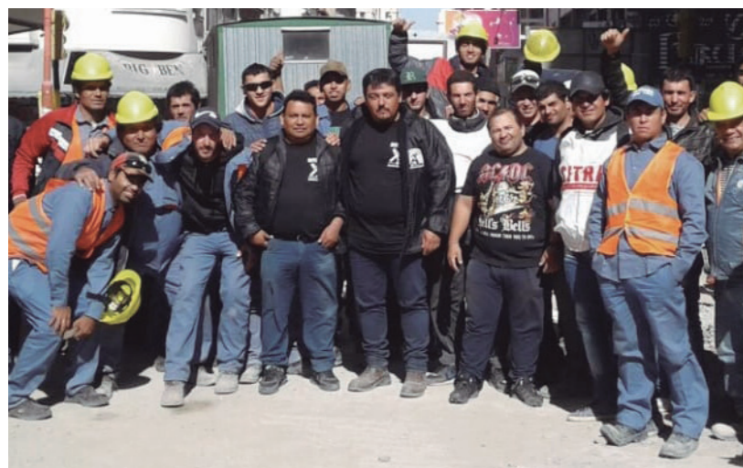
Los trabajadores y el Sitraic ganamos el conflicto

Los trabajadores de la empresa Carcereny Construcciones, afiliados al Sitraic, iniciaron un conflicto junto a la dirección del sindicato, el 26 de marzo. Unos días antes, un trabajador cayó en un pozo con el martillo neumático que estaba utilizando; la obra en la vía pública se desarrollaba sin elementos de seguridad, sin técnico de seguridad e higiene, con recibos de sueldo mal confeccionados, con trabajadores en negro y sin ropa de trabajo.