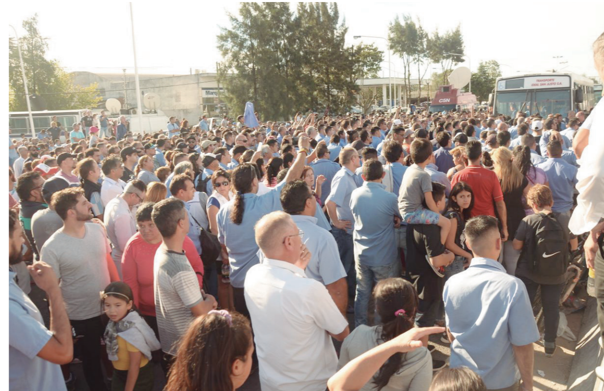
Los choferes dieron una pelea extraordinaria en sus lugares de trabajo y lograron garantizar la medida de fuerza

Por otro lado, Ritondo denunció que Magario no ejecutó el dinero enviado por la provincia a través del Fondo de Seguridad en 2016. La intendenta le retrucó en conferencia de prensa que le traspase la policía local y que "vuelva a mandar a la Gendarmería". Magario pretende reforzar su aparato represivo, metido hasta los tuétanos en la organización del delito en el distrito, y