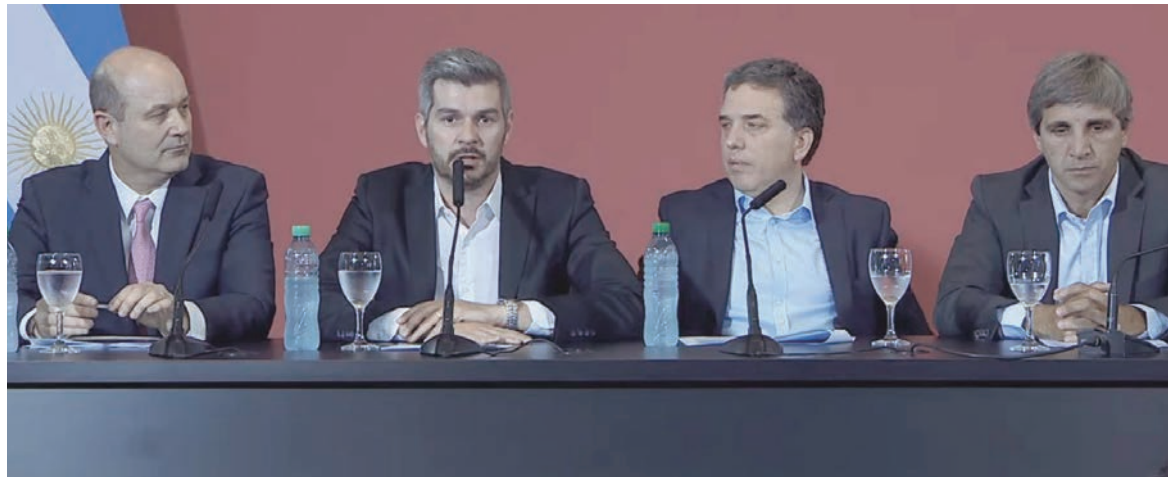
La nueva ‘meta de inflación’, de un 15% anual, ha quedado superada ampliamente en un solo trimestre

El ‘recalibramiento’ de fin de 2017 ha pasado a mejor vida. La nueva ‘meta de inflación’, de un 15% anual, ha quedado superada ampliamente en un solo trimestre. El aumento desbocado de los precios no obedece, sin embargo, al aumento de las tarifas de los servicios, que en principio deberían tener un efecto contrario, deflacionario, pues amputan o confiscan los ingresos de los consumidores y, por lo tanto, la demanda. El gobierno ha financiado esta suba de precios por medio de deuda externa y la consiguiente emisión de moneda que genera, que ha alcanzado el 30% anual y finan-