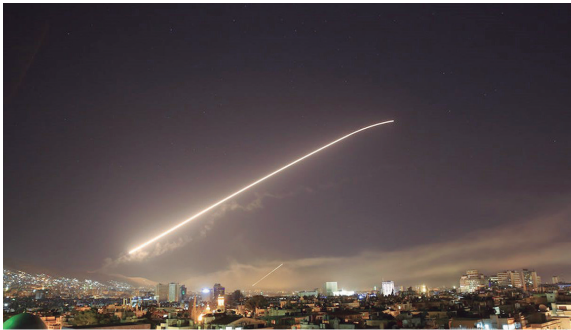
El escenario de Siria es un aspecto del escenario mundial

El ataque criminal perpetrado por Estados Unidos, Gran Bretaña y Francia contra Siria constituye el preludio de un nuevo ciclo de guerras internacionales imperialistas. La intención calculada de evitar una confrontación con Rusia, que controla el espacio aéreo y la mayor parte del territorio sirio, no representa otra cosa que una advertencia de acciones futuras que pueden tener lugar en cualquiera de las zonas en disputa -desde el Medio Oriente a Ucrania y Asia occidental. El bombardeo fue una suerte de ejercicio de la tecnología militar de cada lado, que se manifestó en el derribo de decenas de cohetes yanquis por parte de la defensa aérea suministrada por Rusia a Siria.