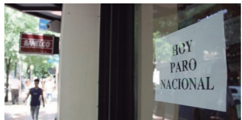
Tribuna Bancaria impulsa un plan de paros progresivos para romper el techo salarial

cuotas). Si se cerrara en un 15%, estaríamos por debajo de la pauta inflacionaria de 2018, y el acuerdo implica, además, la reducción del 50% del bono del día del Bancario y no incluye el bono no remunerativo de enero.