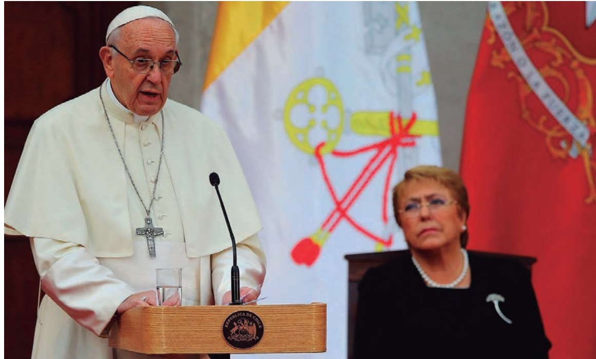
Los escándalos de pedofilia han golpeado duramente a la Iglesia chilena