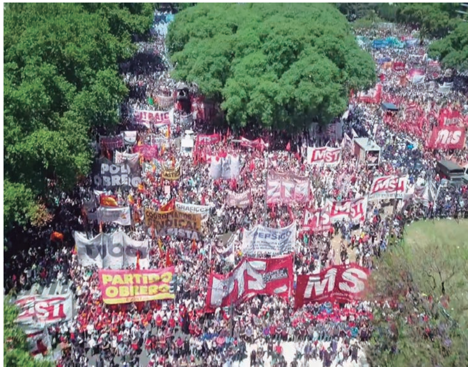
El planteo del Congreso de Bases recoge la necesidad de una acción común de las organizaciones obreras

La amplitud de los temas alcanzados por el megadecretazo obligadamente planteó el interrogante de si se inaugura un período de gobierno por decreto. Hasta los diarios más alcahuetes del oficialismo, que acceden a los chismes del gabinete, comentaron en sus editoriales que durante este año Macri ha decidido eludir al Congreso y gobernar por decreto o por resoluciones administrativas. Los propios comentaristas agregan que esta decisión no debe entenderse como una ruptura con sus aliados pejetistas, sean los gobernadores o el xenófobo Pichetto. Todo lo contrario. Justamente habría sido éste quien sugirió al gobierno manejarse por decreto, para evitar las tensiones que son propias del debate parlamentario. Es que por su propia dinámica, que incluye la exposición pública y un relativo espacio temporal, el debate parlamentario ofrece una brecha donde puede meter la cola la movilización popular. Fue así como ocurrió con la acción popular contra la reforma previsional, que creció exponencialmente entre su aprobación en el Senado y el tratamiento en la Cámara de Diputados. El gobierno no le teme a Pichetto y ni siquiera a los discursos de Cristina Kirchner en el Senado, sino a nuevas y masivas acciones populares