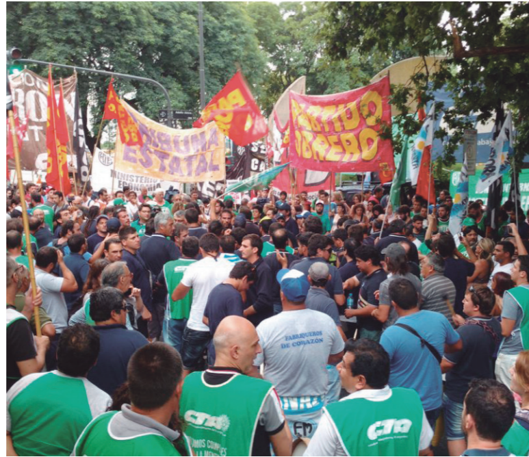
Los despidos masivos enfrentan una gran respuesta obrera

Los trabajadores de Fanazul, la fábrica de explosivos cuyo conflicto se ha transformado en uno de los más importantes contra la ola de despidos entre los estatales, habían realizado el domingo pasado una caravana contra el cierre y los más de 200 despidos hacia la puerta de la planta, de la que participaron aproximadamente 200 vehículos. La movilización culminó con una suelta de globos y paños protagonizada por los hijos