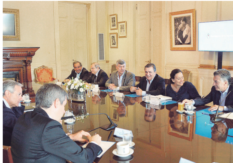
El paquetazo otorga al Ejecutivo facultades muy amplias y márgenes discrecionales de acción

Esto significa piedra libre para los capitalistas, ya que con sanciones irrisorias tienen un incentivo para seguir practicando los abusos laborales como viene