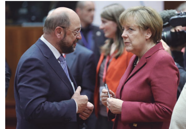
Schulz y Merkel. Alemania no ha podido escapar a las tendencias disolventes de la Unión Europea

La canciller alemana, Angela Merkel, junto con el líder socialdemócrata Martin Schulz, lograron -tras una maratónica negociación de 24 horas- alumbrar un principio de acuerdo para formar gobierno, después de 111 días sin poder concretarlo luego de los comicios. Este acuerdo agónico provocó una sensación de alivio en los principales círculos de poder mundial. Pero el tema no está cerrado. Apenas dos días después de sellado el compromiso, han empezado a asomar las primeras grietas. "Las poderosas juventudes del SPD han puesto en marcha una campaña para derribar el embrión de alianza, mientras otros dirigentes han pedido mejoras en el pacto y los direcciones del partido de dos estamentos federados han votado en contra" (El País, 16/1). Las fisuras, en caso de que se extiendan podrían desembocar en un naufragio si el congreso extraordinario convocado por el SPD para abordar el punto rechaza la propuesta.