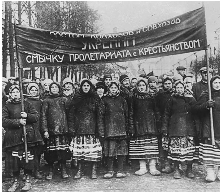
Por primera vez en la historia el campesino encontró su guía en el obrero

sobre la maduración de las condiciones para la toma del poder y por el inexorable avance de la revolución en el campo. Las estadísticas oficiales revelaron mes a mes este desarrollo: en mayo hubo 152 casos de apoderamiento de fincas por la fuerza, en junio, 112; en julio 387; en agosto 440; en septiembre 958. Hacia el otoño ruso la rebelión es creciente y no deja rincón de Rusia sin recorrer (sobre 624 distritos, en 482 crecía la marea campesina en territorios en los que las decisiones de las asambleas campesinas tendían a ser tomadas como leyes. Para una investigadora, “irónicamente, esa orden (el “Decreto sobre la tierra”) mostró la impotencia del gobierno central (Gobierno Provisorio encabezado por Kerensky) puesto que los campesinos habían tomado casi todas las tierras privadas antes de octubre”. Ciertamente que fue el gobierno soviético el que confirmó esa apropiación y fue la llave maestra del apoyo campesino al gobierno soviético en las aciagas horas por venir, en la Guerra Civil frente a los ejércitos blancos organizados por las potencias imperialistas.