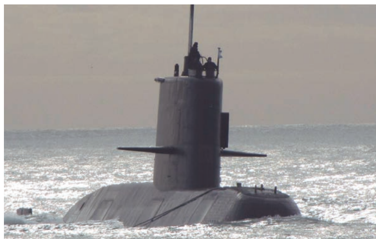
El macrismo conocía las contrataciones irregulares en el sector naval

Lo que sabía el macrismo antes de mandar el submarino al mar