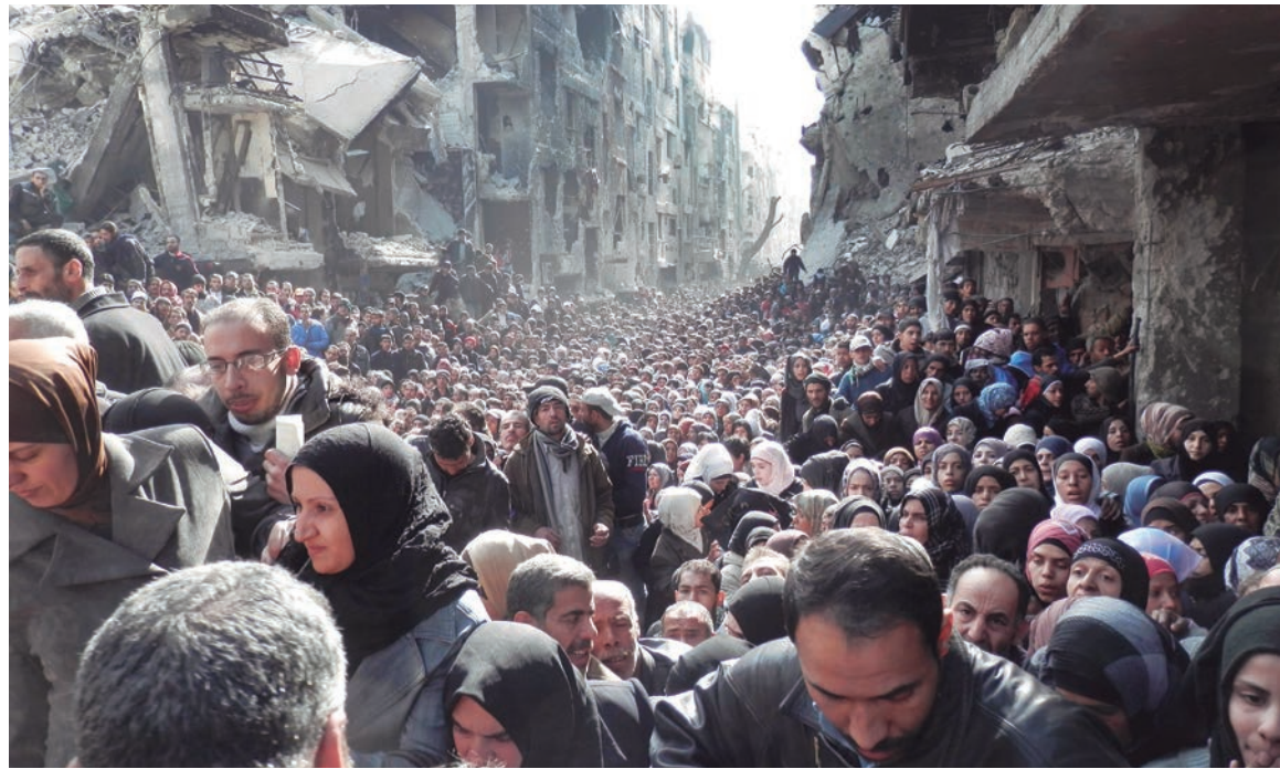
La disputa por el control estratégico de Medio Oriente se intensifica

El objetivo es poner en marcha una transición política controlada y monitoreada por Washington y Moscú. "Y salvo alguna sorpresa de último momento, ninguna de las soluciones negociadas parece incluir la salida de al-Assad" (ídem). El régimen sirio ha recuperado terreno el último año. Las tropas del gobierno controlan las cuatro principales ciudades de Siria, diez de sus 14 capitales provinciales y la costa. Ninguna fuerza en el terreno tiene la capacidad de desplazar a al-Assad de ese escenario. En el frente diplomático, los principales aliados de los opositores al régimen -o sea, Estados Unidos y sus socios- retiraron su exigencia de que cualquier acuerdo debía