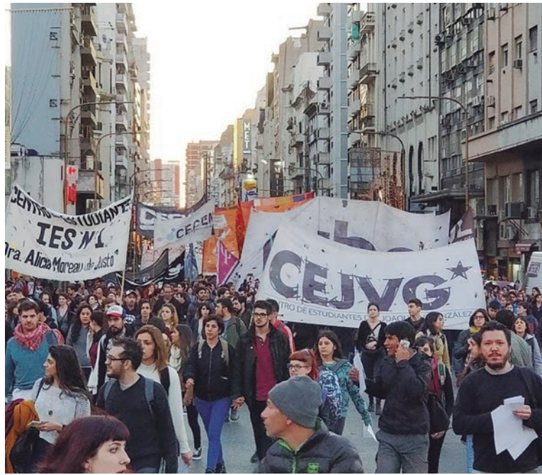
La reforma recorta contenidos y disciplinas y forma “áreas generales”

• Precarización del trabajo docente y desconocimiento del estatuto docente: con la excusa de la falta de docentes en Capital, que obedece a las condiciones materiales y sociales en las que se desarrolla la actividad -salario de 13.809 pesos y sin recursos-, los estudiantes realizarán “prácticas” desde el inicio para reemplazar a docentes con expe-