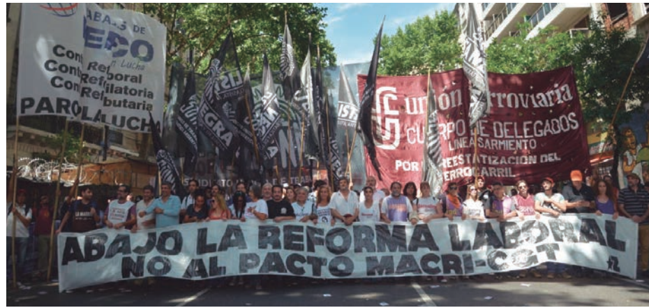
El clasismo y el FIT organizaron una columna independiente

El sector convocante no se empeñó en una movilización de masas. El poder de sindicatos como bancarios o camioneros, si organizan un paro activo con abandono de tareas, es considerable. Y junto a la docencia y otros sindicatos del clasismo, podrían haber logrado el doble de convocatoria y multipli-