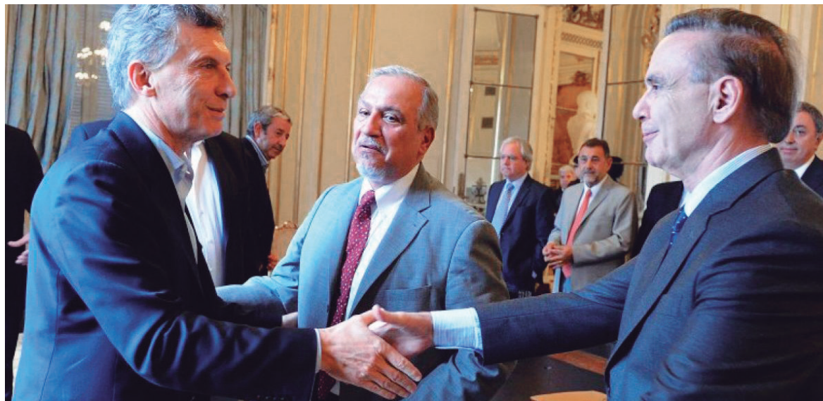
Con los cambios, el Estado sustrae 96 mil millones de pesos a los jubilados en 2018

Triaca, atento, lo aprobó en minutos. Calculó que de los 100 mil millones de pesos de "ahorro" fiscal 2018, se podría pasar a uno de 96 mil millones. La montaña de plata que va del bolsillo de los jubilados al Estado equivale a un punto del PBI -o