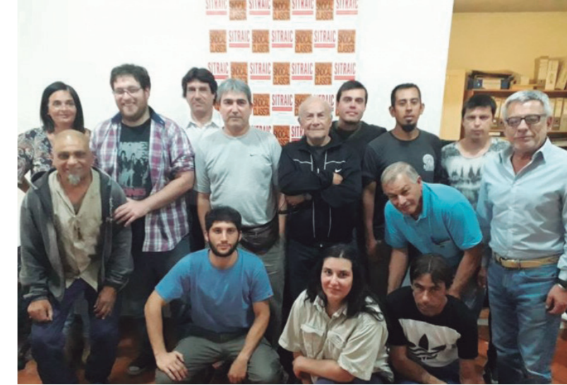
Trabajaremos hacia un Plenario Obrero de trabajadores y trabajadoras de la zona sur para el 15 de diciembre

Ante esta situación, desde la CSC consideramos que se abre una oportunidad para organizar y reagrupar a nuevos sectores del movimiento obrero en el campo del clasismo y la lucha independiente contra las patronales y sus variantes políticas ajustadoras. Por este motivo resolvimos: por un lado, desarrollar una fuerte actividad de difusión de nuestras posiciones en los principales lugares de trabajo, incluyendo la