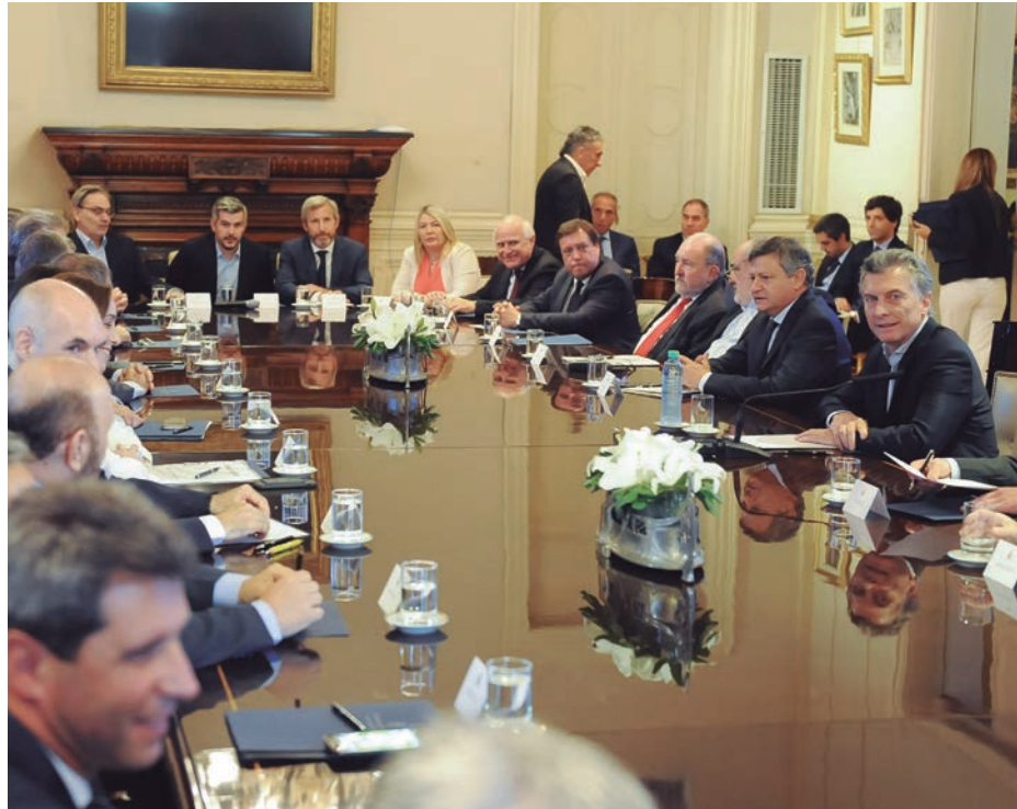
Macri, junto a los gobernadores y otros funcionarios

En estas horas, el gobierno y los gobernadores del PJ, el FpV, massistas y “socialistas” discutían la letra fina de un pacto fiscal con consecuencias explosivas para las provincias y sus trabajadores. El macrismo exige la eliminación gradual del impuesto a los Ingresos Brutos de las empresas que representa, en promedio, el 75% de la recaudación de los distritos. A cambio de ello, el gobierno les ofrece una mayor tajada del impuesto a las ganancias, a costa de quitársela a la Anses. Como consecuencia de ese despojo, y de la rebaja de aportes patronales que también anunció el gobierno, la caja de los jubilados sufrirá una pérdida anual de 10.000 millones de dólares. Eso explica la anunciada decisión de amputar el sistema de “movilidad” jubilatoria, condenando al 70% de los pasivos a percibir la mitad de una canasta de pobreza. En suma, los jubilados bancarán la eliminación de impuestos a los capitalistas. Pero ello no bastará para cerrar los números de las provincias: por eso, el gobierno apura un nuevo ‘pacto de responsabilidad fiscal’, que implica ajuste en los gastos sociales y despidos. En las negociaciones en curso, el gobierno habría ofrecido tomar a su cargo a las trece cajas previsionales que dependen de provincias, con regímenes jubilatorios propios.