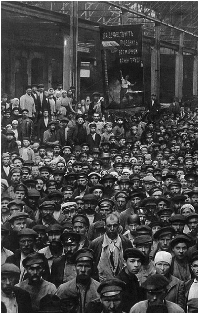
Obreros de la fábrica Putilov

Se plantea después la cuestión de la creación del Buró Político del Comité Central. Se decidió formar el Buró con los siete camaradas siguientes: Len(in), Zin(oviev), Kam(enev), Tr(ostki), Sta(lin), Sok(olnikov), Bub(nov).