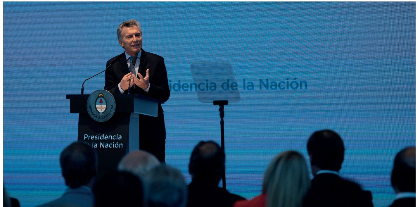
Anuncios presidenciales en el CCK.

La reducción de los aportes patronales a