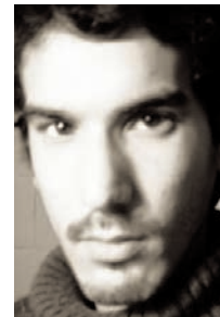
MARIANO FERREYRA LA LUCHA CONTINUA

Cómo enfrentamos el plan de guerra de Macri