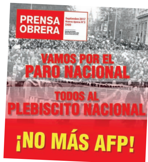
Facsimil del periódico del Partido Obrero Revolucionario

Sebastián Piñera, el ex presidente y actual candidato pre-