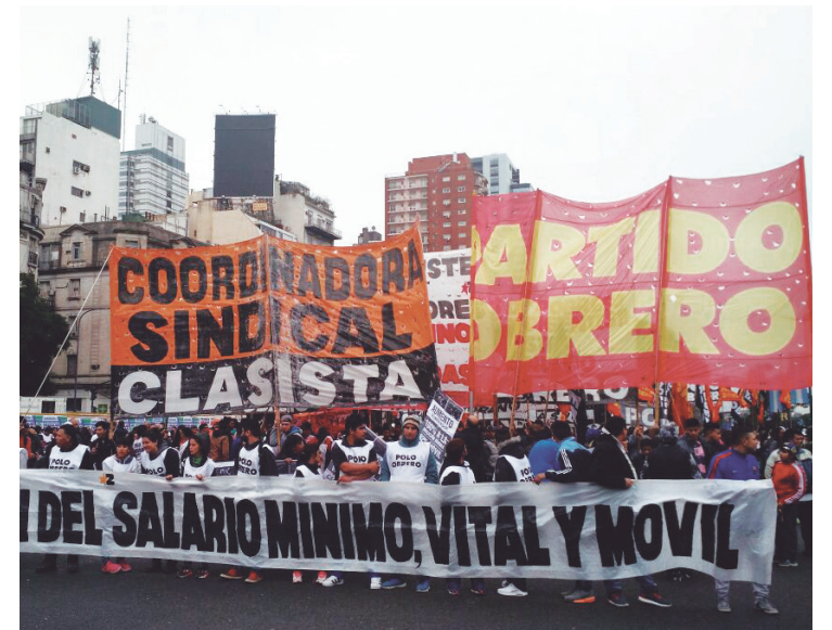
La Coordinadora Sindical Clasista, el Polo Obrero y el Partido Obrero se movilizaron al Ministerio de Trabajo, donde sesionó el Consejo del Salario