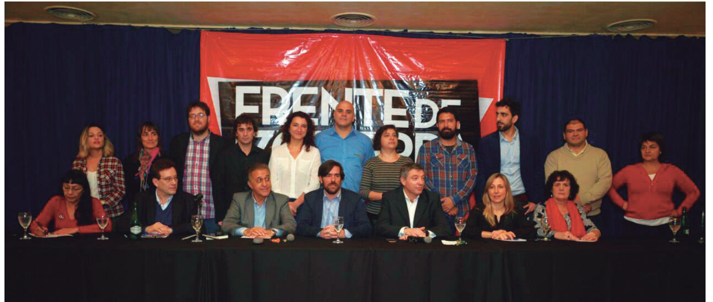
El Frente de Izquierda es el único bloque independiente del régimen de ajuste e hipotecamiento nacional

La ex presidenta salió al ruedo con una suerte de "borrón y cuenta nueva". En cierto modo, la Unidad Ciudadana reitera la pretensión -varias veces ensayada en el pasado- de un nuevo movimiento político. Así habían sido la "confluencia plural", la "transversalidad", los Unidos y Organizados o el Frente para la Victoria. Pero ninguna de aquellas tentativas rompió los lazos del kirchnerismo con los punteros pejetistas y la burocracia sindical. Este nuevo ensayo del 'nuevo' movimiento, ahora desde afuera del poder político, es una versión desteñida de las anteriores. Detrás de algunos cristinistas de fachada, subyacen los Espinoza y Scioli; en materia sindical, CFK lleva de candidato a Hugo Yasky, el responsable de dejar a la docencia inerme frente al ajuste macrista. Más abajo, las listas de concejales quedaron en manos de los intendentes pejetistas que pactaron todos los ajustes posibles con la gobernadora Vidal. En el interior, el kirchnerismo se ha di-