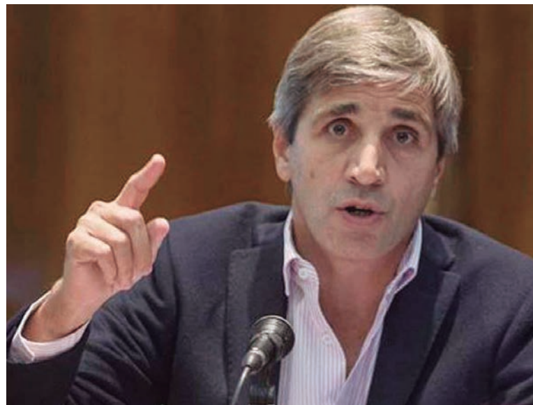
El ministro de Finanzas, Luis Caputo

dólares (fue vendida por debajo de su precio nominal, lo cual aumenta los beneficios de los inversores), representa monedas, por supuesto, pero señala una orientación enteramente determinada para beneficiar al capital internacional y para condicionar la economía argentina a los com-