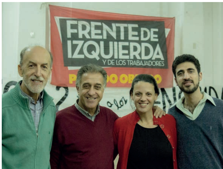
Junto a los candidatos locales

Al abordar el fracaso de la política oficial indicó: “hablan de bajar el costo laboral pero el propio Indec señala que la mitad de los trabajadores ganan entre 8.500 y 11.000 pesos en promedio”. En Bahía Blanca uno de cada cuatro asalariados no llega al salario mínimo de 7.560. Y los trabajadores que cobran salarios mayores están rápidamente alcanzados por el confiscatorio impuesto a las ga-