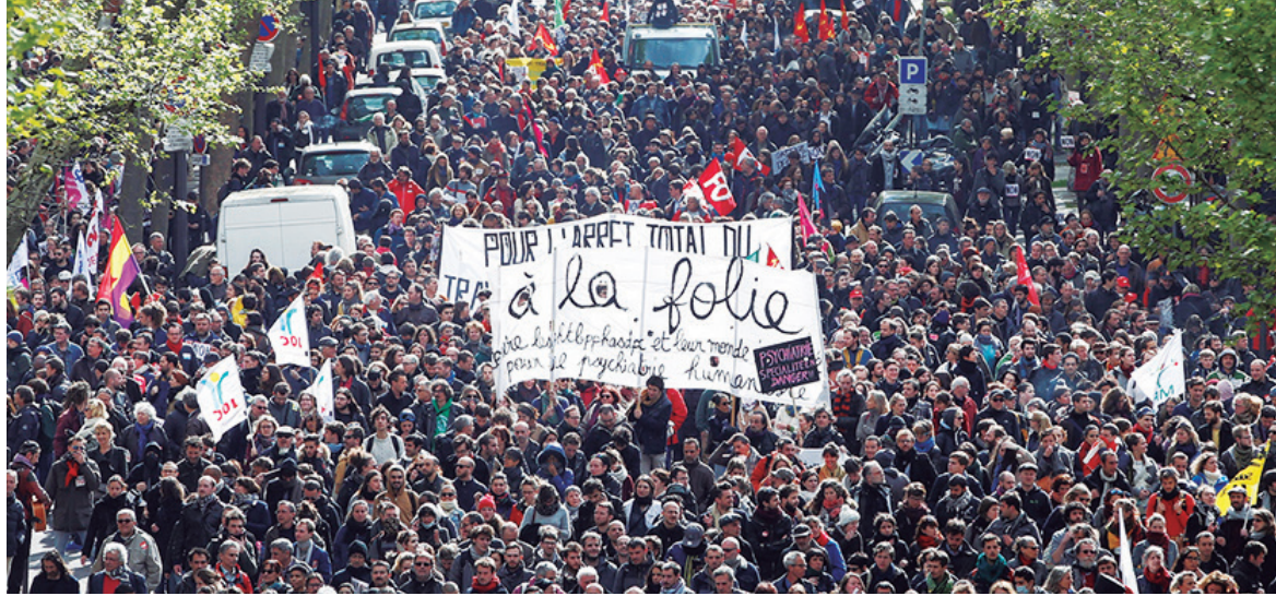
Movilización contra la reforma laboral en Francia

La bancarrota capitalista de 2007/8 señaló el ingreso a una nueva etapa en la transición histórica de la crisis mundial que se inició a finales de los años '60. La tendencia a la disolución del capitalismo dio un salto cualitativo y ha obligado al