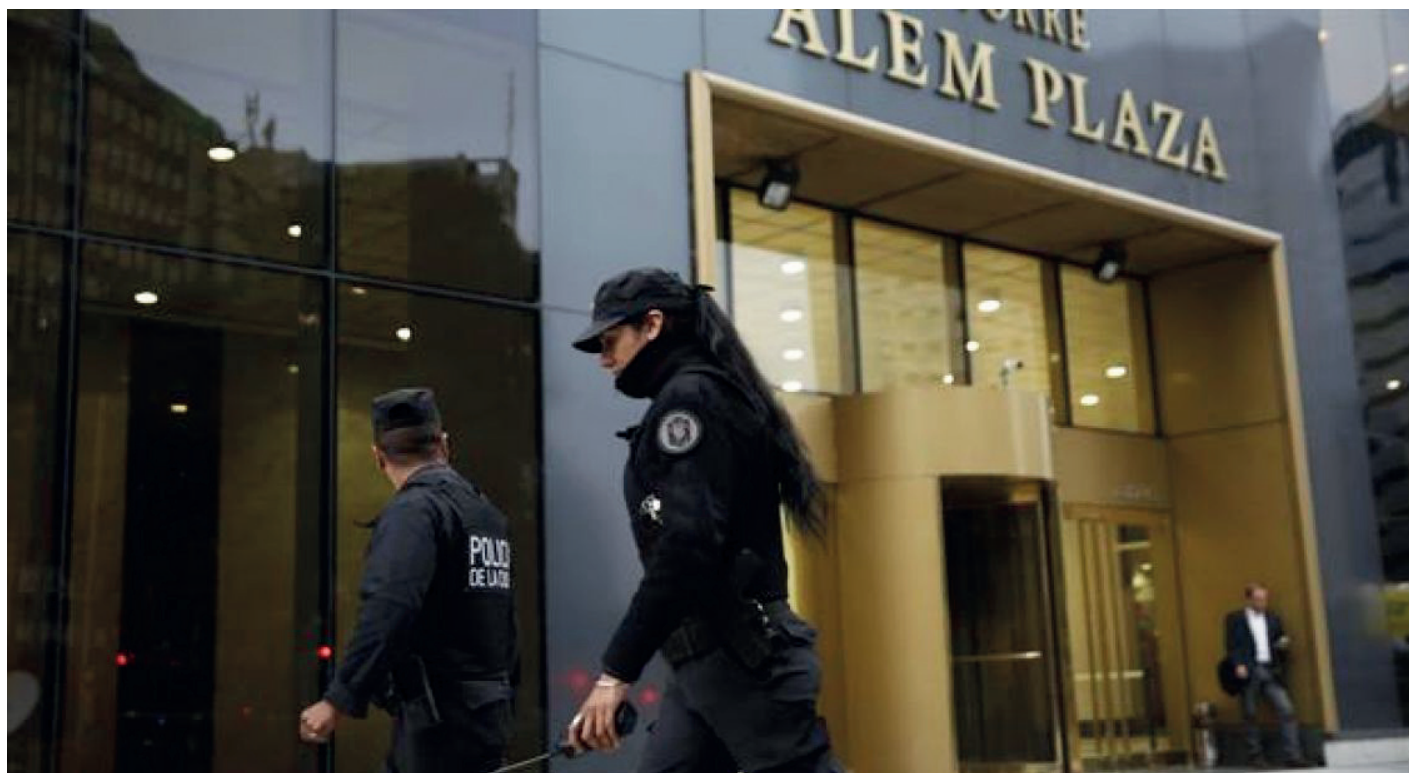
Las oficinas de Odebrecht en Buenos Aires fueron allanadas

En ese cuadro, Odebrecht le ha ofrecido a la Justicia local el 'modelo' de acuerdos que ya ha practicado en otros países de la región -a saber, la entrega de la información sobre coimas a funcionarios a cambio de la continuidad de sus contratos de obra pública. Los fiscales de la kirchnerista Gils Carbó, que protegen a los De Vido, alegan que la legislación argentina no permite un acuerdo con un alcance tan vasto. Pero en nombre de las trabas interpuestas por los fiscales K, el gobierno puso en marcha otra operación de encubrimiento, si se quiere, aún más aleve: por indicaciones del propio Macri, iniciaron una negociación directa con Ode-