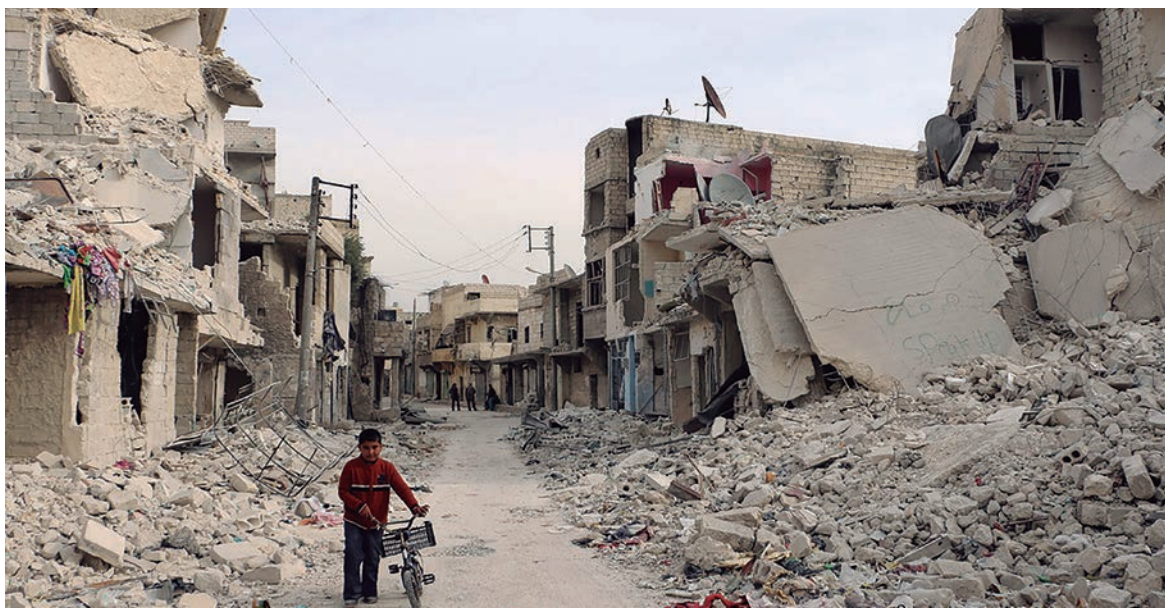
Imágenes de la devastación en Aleppo, Siria

Los Macri y los Temer gozan, por un lado, de un respaldo masivo de la burguesía y del capital extranjero, que se manifiesta en el apoyo sistemático que reciben de los partidos de oposición, del Parlamento y de la burocracia sindical. El capital entiende que un derrumbe de estos gobiernos crearía situaciones pre-revolucionarias; en algunos casos (Lula, Kirchner), los movimientos 'nacionales y populares' se reservan como recurso de última instancia. Estos gobiernos derechistas organizan su viabilidad mediante la explotación de las contradicciones políticas del movimiento de las masas. Han procedido a un enorme endeudamiento internacional para financiar una salida a la crisis, que incluso a corto plazo podría llevarlos a la bancarrota. La 'governabilidad', en América Latina, se asienta, en lo fundamental, en la crisis de dirección de los explotados. Esto es muy claro en Venezuela, donde la izquierda actuó como