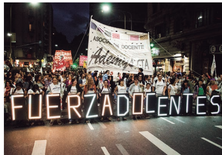
Marcha de antorchas de Ademys