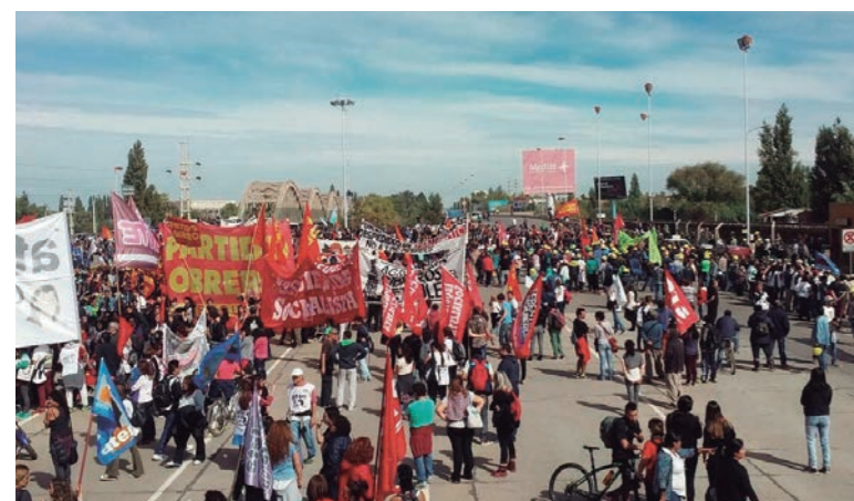
En Neuquén, cinco mil personas de movilizaron al puente

La jornada de paro general activo impulsada por el sindicalismo clasista y la izquierda tuvo un punto alto en el acto en el Obelisco, convocado por el Sindicato Único de Trabajadores del Neumático de la Argentina (Sutna), la Asociación Gremial Docente (AGD-UBA), Suteba La Matanza, entre otros, y que reunió a los más granados del gremialismo combativo en el emblemático monumento porteño. La movilización ayudó a darle carácter activo al paro general, que había comenzado de madrugada con los piquetes instalados en las principales ciudades y centros industriales del país y que tuvieron su epíteto en los cortes en los accesos a la ciudad de Buenos Aires y en las principales rutas del conurbano bonaerense, mientras que la burocracia de la CGT llamó a quedarse en casa mateando.