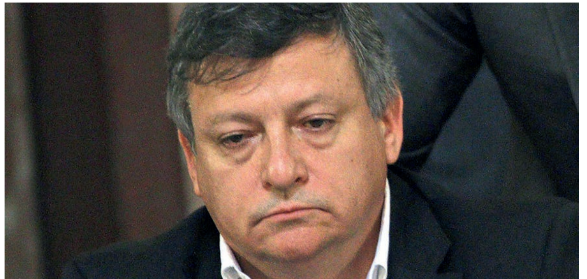
Domingo Peppo, gobernador chaqueño.

El gobierno provincial analiza adelantar las elecciones para desdoblarse el cronograma electoral, votando primero los cargos de diputados provinciales y luego los de senador y diputado nacional. Esta maniobra implicaría una modificación de la Ley de Primarias Abiertas Simultáneas y Obligatorias provinciales, que establece en su artículo 3º que cuando se trate de elecciones legislativas la fecha de las PASO coincidirá con el calendario nacional.