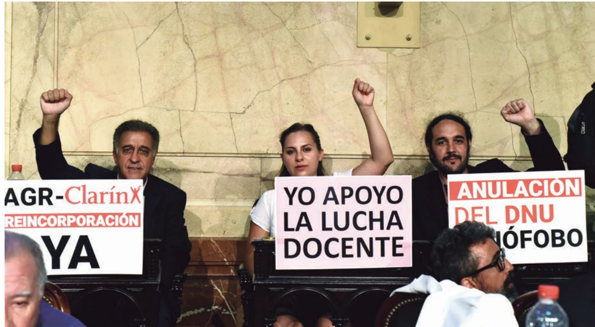
Los diputados del PO-FIT en la apertura de sesiones del Congreso de la Nación.