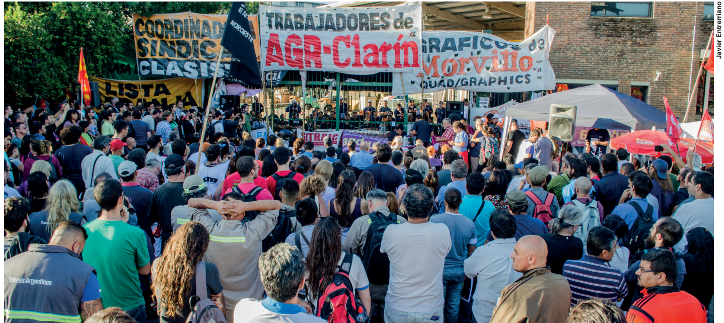
Plenario obrero en las puertas de AGR-Clarín del lunes 6

La ofensiva antiobrero también es un recurso del gobierno para sacarle base de sustentación a la oposición patronal de los Massa, Pichetto y compañía. Las divergencias entre los sectores capitalistas se dejan de lado cuando se trata de establecer la relación del Estado y el capital con la clase obrera. La UIA puede protestar por el crecimiento de las importaciones o el atraso cambiario, pero aplaude entusiasta la campaña contra los convenios colectivos, la modificación del régimen de las ART o el techo a las