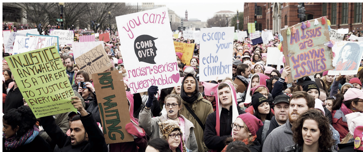
Casi 500.000 mujeres se movilizaron en Estados Unidos contra el presidente Donald Trump

El triunfo de Donald Trump en EEUU, con la furia de un discurso racista, misógino y antiobrero, ha despertado a un gigante que estaba dormido. El 21 de enero la manifestación de 2 millones de personas en diferentes estados contra Trump produjo la mayor movilización de los Estados Unidos desde las décadas del 60 y 70. El intento demócrata por colocarse en este campo para recuperar el terreno perdido en el último proceso electoral no ha podido evitar que varios sectores levanten su voz para recordar que la agresión contra las mujeres, en particular contra las latinas y la negras, no es privativa de esta administración (declaración de académicas norteamericanas, ver página 15). La administración Obama produjo uno de los mayores movimientos migratorios, expulsando a 3 millones de personas del territorio estadounidense. Los ataques policiales contra negros y pobres recordaron las peores épocas de segregación racial. La funcionaria y luego candidata Hillary Clinton, fue la ejecutora directa de la triplicación de iniciativas belicistas de parte del