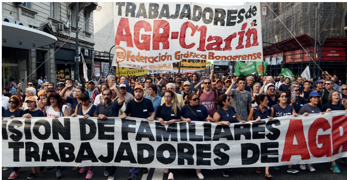
Movilización al Ministerio de Trabajo del viernes 3 de febrero

nía de perpetuar Ganancias, de acompañar silenciosamente el DNU de ART, de justificar una revisión flexibilizadora del convenio colectivo de Vaca Muerta y de acompañar un año entero de ajuste. Nada de esto apaciguó la ofensiva contra la clase obrera. Por el contrario, esa escalada se ha profundizado. En medio del fracaso para controlar la inflación, de la recesión económica y del encarecimiento de la política de hiperendeudamiento internacional, la ofensiva contra la clase obrera se ha constituido en el eje de la política oficial, y el recurso de Macri para disimular, ante el círculo rojo, el empantanamiento de su política.