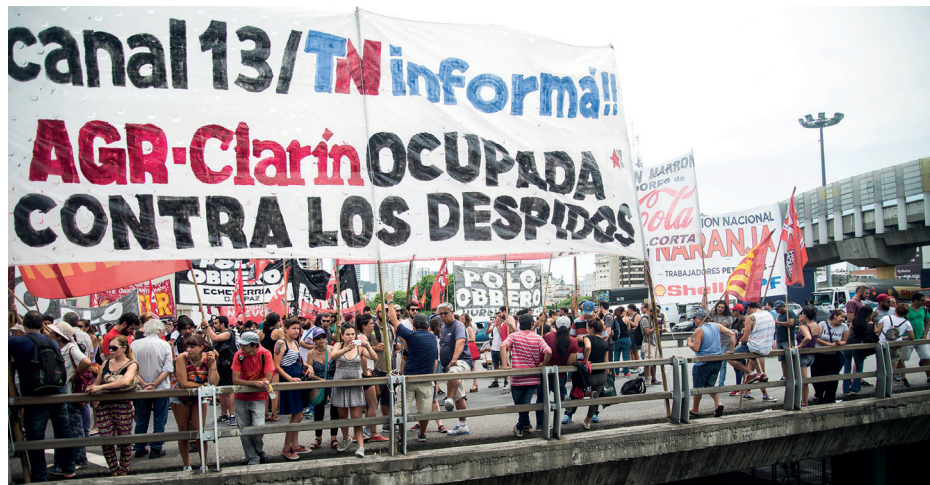
Movilización y corte frente a las oficinas de Canal 13-TN del martes 25

costa de la seguridad en el trabajo. Como ya ocurriera con Ganancias y la ley "anti-despidos", el episodio de las ART volverá a demostrar la completa inconsistencia de la demagogia "social" de los opositores, cuando lo que está en juego es la agenda de la gran burguesía.