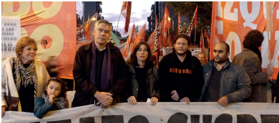
Colocar al FIT como una alternativa política requiere de una estrategia de independencia política y de una agitación concentrada en la lucha contra el gobierno y los ajustadores.

De esta caracterización, se desprenden las tareas que debe abordar la izquierda incluido el propio proceso electoral: "Es todo un señalamiento para el Frente de Izquierda: la campaña electoral no será el devenir pacífico de las tendencias