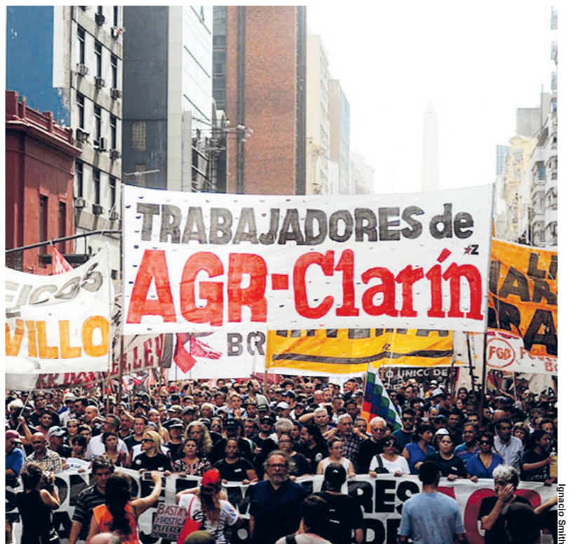
Movilización al Ministerio de Trabajo del jueves 19.

En otros talleres, la presencia y la distribución del volante del conflicto de AGR constituyó un gran aporte para que los trabajadores decidieran abandonar sus puestos de trabajo y defender el paro del gremio, del que no habían sido anunciados por sus propios delegados.