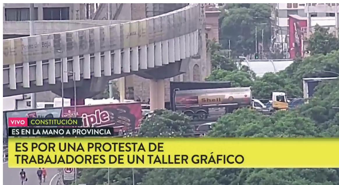
La cobertura de TN sobre el corte omitió la responsabilidad del Grupo Clarín en el vaciamiento

superada por algunos periodistas que cuentan con producción propia, y que difundieron la huelga o la represión a la planta en sus programas. O por los trabajadores de prensa que presionaron encarnizadamente para que la noticia de la ocupación de AGR se divulgara. En "La Nación", la decisión de la patronal de "deslinkear" una