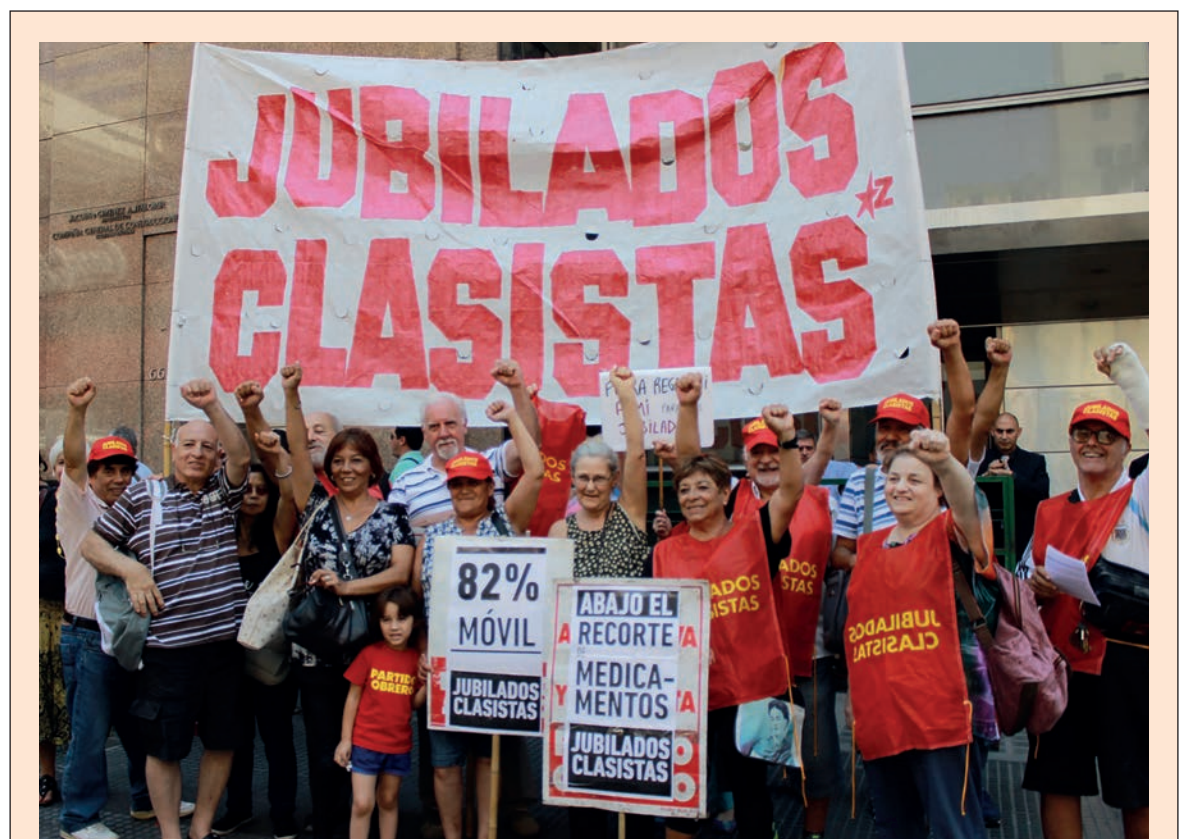
El Partido Obrero y Jubilados Clasistas realizaron un acto frente al PAMI el 11 de enero en repudio al ajuste en la entrega de medicamentos.

Todos los partidos que gobernaron son responsables de la quiebra del Pami y del sistema previsional. Menem y Cavallo, en los años '90, rebajaron a la mitad los aportes patronales y congelaron la indexación de las jubilaciones. Los gobiernos K mantuvieron el régimen previsional heredado de los "neoliberales" y utilizaron las cajas del Pami y de la Anses para pagar los